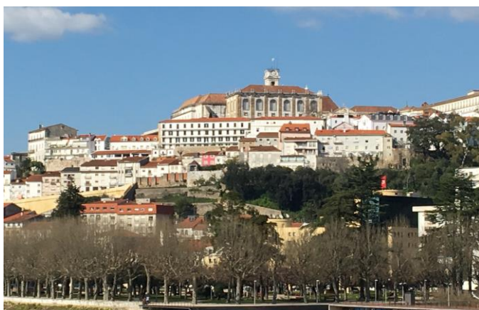
Foto: cidade de Coimbra

Coimbra é uma cidade da parte central de Portugal, no ano 2020 contava com uma população de 135 mil habitantes, segundo o Pordata (2020), lá está concentrado também uma boa parte do PIB do país, mais de 20% na região (INE, 2020). Coimbra é uma cidade universitária, desde a fundação da Universidade de Coimbra em 1 de março do ano de 1290. Atualmente, mais de 20% da população da cidade tem ligação com a universidade, direta ou indiretamente.