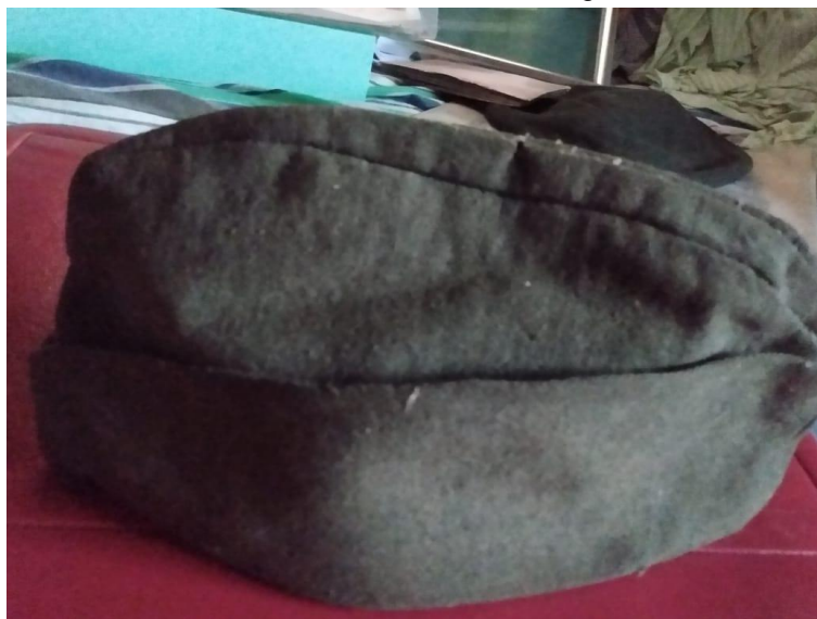
Figura 3 - Boina do uniforme oficial usada na Segunda Guerra Mundial.