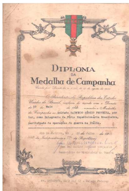
Figura 4 - Foi condecorado com o Diploma de Medalha de Campanha por participar como integrante da FEB de operações na Itália, expedido pelo Ministério da Guerra, em 26 de julho de 1945.