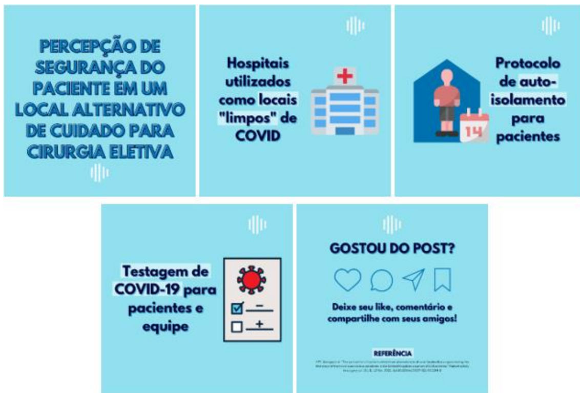
Figura 3 – Exemplo de telas de um post em estilo carrossel narrado

As postagens foram realizadas nos meses de fevereiro e março de 2022, e até o mês de julho do mesmo ano, receberam de 47 a 130 visualizações.