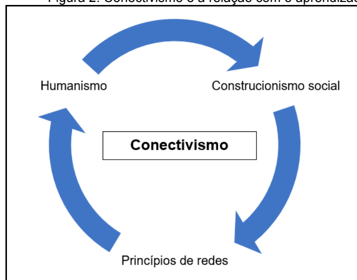
Figura 2: Conectivismo e a relação com o aprendizado

O ensino fundamental, já está recebendo em suas séries iniciais aprendizes da geração Alfa, nascidos após o ano de 2010, que em pouco tempo estarão no ensino médio e superior, fatos que tornam necessárias ações sistemáticas de planejamento com a implementação de novas estratégias didáticas e metodologias diferenciadas ao ensino e aprendizagem. Proporcionando aos docentes e instituições, discutirem a relação do humanismo para o uso das redes sociais, o construcionismo de natureza social a partir do aprendizado e do conhecimento completo, assim como os princípios de redes com o aprendizado cíclico do indivíduo, conforme apresentado na Figura 2.