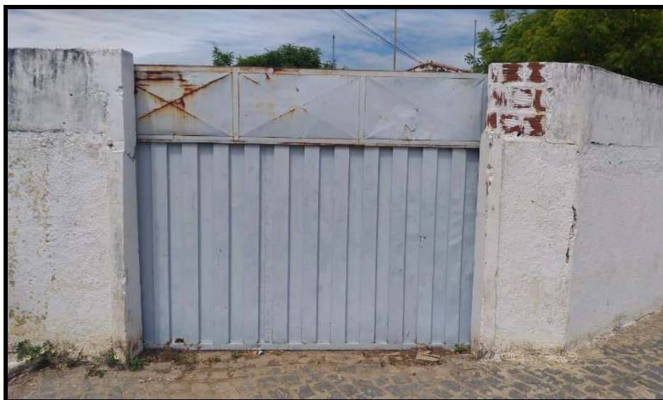
Figura 3 - Portão de acesso da edificação

O atual acesso das viaturas à edificação não pode ser feito pela rua frontal ao estabelecimento que possui um portão de acesso de aço galvanizado de correr (Figura 3) e que dá acesso direto ao estacionamento, aos blocos das salas de aula, biblioteca e administrativo. Além do espaço reduzido, o portão de acesso, apesar de estar totalmente desobstruído, possui largura de 2,95 m, valor bem menor da mínima estipulada pela NT N° 014/2016 – CBMPB que é de 4 m.