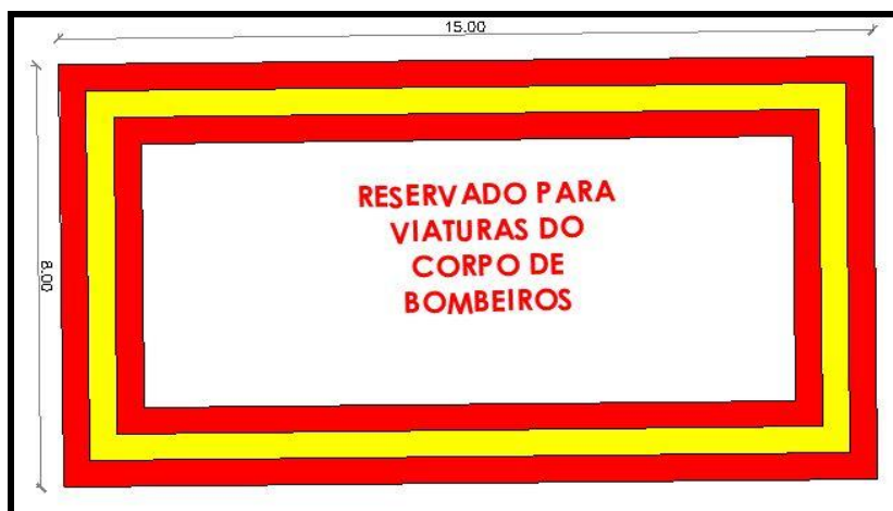
Figura 8 – Vaga de Estacionamento para viatura

providenciado junto ao prédio, com dimensões mínimas de 8,00 m de largura e 15,00 m de comprimento, com distância para um dos lados da edificação de 8,00 m.