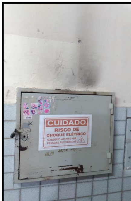
Figura 7 – Quadro de distribuição dos circuitos terminais.

Ainda sobre as condições que possam representar algum risco para os ocupantes e a edificação, pôde-se constatar a existência de fiação elétrica exposta, resultado de restaurações e ampliações improvisadas naquele estabelecimento, que apesar de não está diretamente relacionada a algum sistema de proteção contra incêndio, pode ser responsável pelo início de um. Segundo funcionários do local, no ano de 2019, houve um princípio de incêndio ocorrido no quadro de distribuição dos circuitos terminais (Figura 7) localizado no interior da secretaria, o qual ainda é possível constatar, pela imagem, os resquícios de marcas na parede deixado pelo fogo.