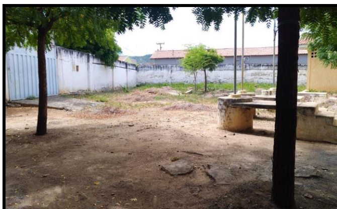
Figura 4 - Estacionamento da edificação

A Figura 4 demonstra o local destinado ao estacionamento, que não é pavimentado, possui piso irregular e apresenta elementos paisagísticos, assim como três porta-bandeiras consumindo a área útil do ambiente.