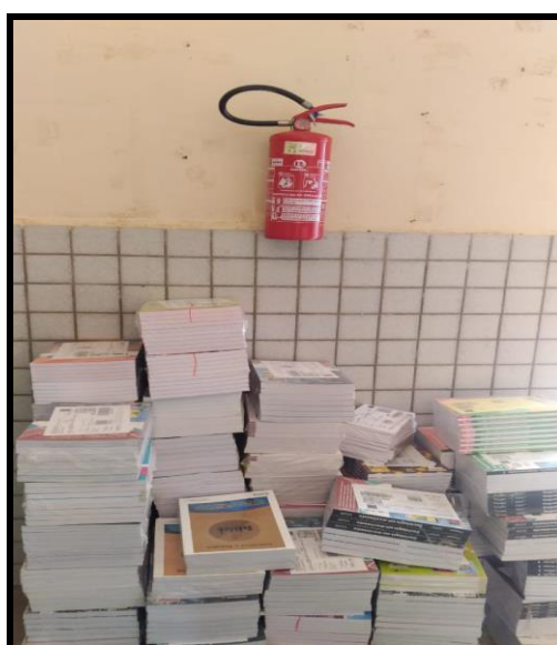
Figura 6 – Extintor sem sinalização

Referente ao sistema de extintores, este apresentou graves discordâncias ao que se preceitua a NBR 12693/2021. Constatou-se que não há unidade extintora instalada na edificação que cumpra os requisitos mínimos de instalação e proteção, caracterizada por no mínimo, duas unidades extintoras distintas, sendo uma para incêndio de classe A e outra para classes B:C ou duas unidades extintoras para classes ABC. A edificação conta com três unidades de extintores: um na secretaria, de Classe BC; outro no laboratório de informática; e mais um no laboratório de química, ambos de Classe B: C. Apesar de estarem na altura recomendada, encontram-se em lugares fechados, obstruídos, e sem nenhuma sinalização referente (Figura 6), o que acaba dificultando a familiarização dos usuários quanto à sua localização. Em casos de ocorrência de um princípio de incêndio em um destes ambientes, a simples busca ao equipamento, põe em risco a integridade do indivíduo que ali se aventura.