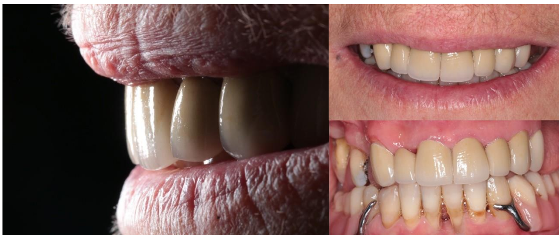
Figura 9 – Coroas metalocerâmicas cimentadas e fotografia final.