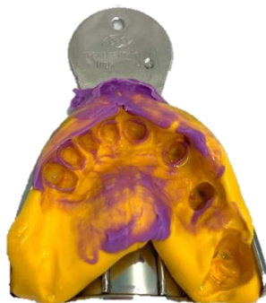
Figura 6: Moldagem com silicone de adição.