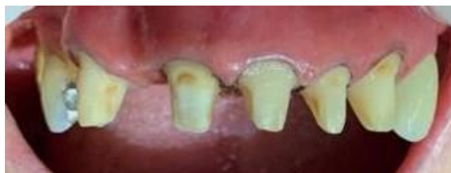
Figura 4 – Preparos