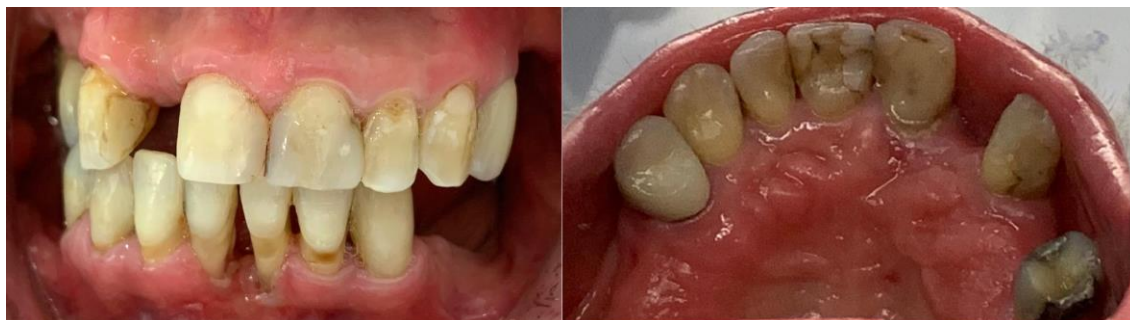
Figura 2 – Fotografia intraoral inicial.