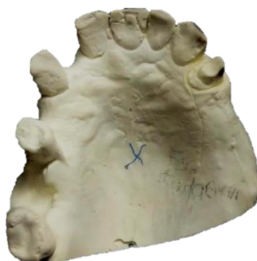
Figura 3 – Modelos de gesso