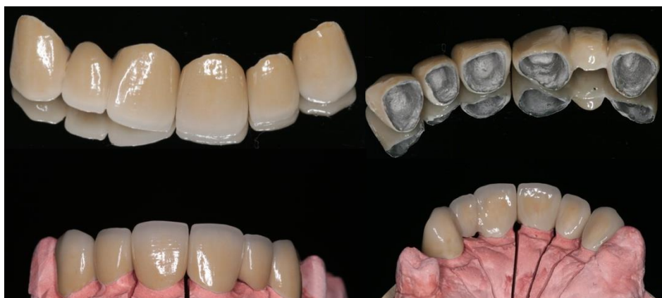
Figura 8 – Coroas metalocerâmicas