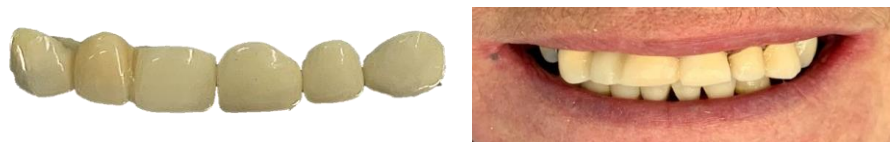
Figura 5: Provisórios