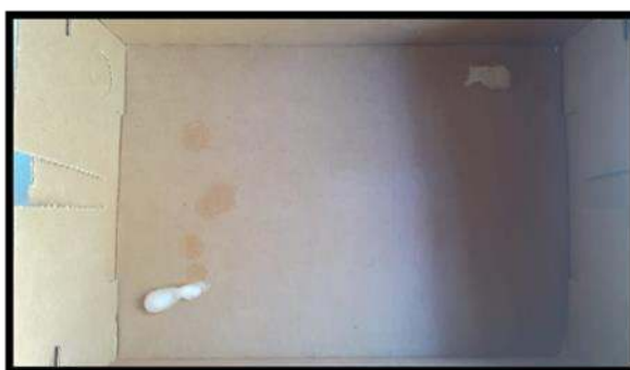
Imagem 2 – Arena com as amostras do segundo experimento.

Terceiro Relato (3º discente) - Com o intuito de deixar as formigas por 24 horas em Jejum, foram alocadas as formigas dentro de um copo de vidro e, este, em cima da estante. No dia seguinte, antes mesmo de completar o tempo previsto sem comida, as formigas estavam mortas.