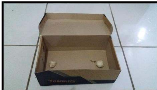
Imagem 1 – Arena com as amostras do primeiro experimento.

Segundo Relato (2º discente) - O primeiro passo para analisar a atratividade alimentar das formigas, foi deixá-las em jejum.