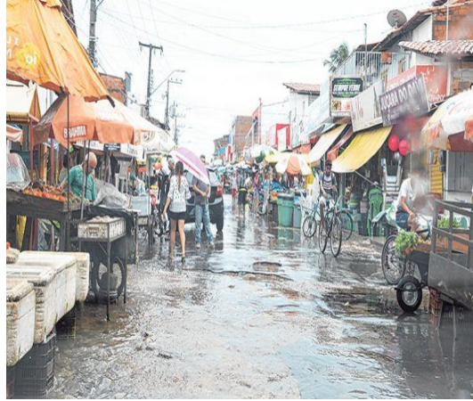
Figura 5 – Esgoto invadindo a área comercial.