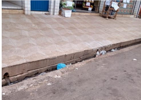
Figura 2 – Esgoto a céu aberto próximo a frigoríficos.