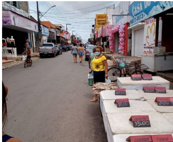
Figura 3 – Peixes sendo vendidos e armazenados a céu aberto.