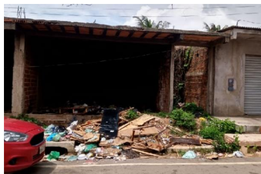
Figura 2– Lixo acumulado em terreno abandonado próximo a feira.

Na referida feira, foram encontrados muitos animais circulando livremente próximos aos alimentos, como cachorros e gatos. A estocagem era feita em caixas de papelão e plástica, próximas, também, da circulação de animais. As estruturas não eram bem localizadas, algumas barracas ficavam no meio de uma rua sem nenhum cuidado com seus produtos. Em ambas as feiras, as condições das estruturas e instalações das barracas, eram precárias.