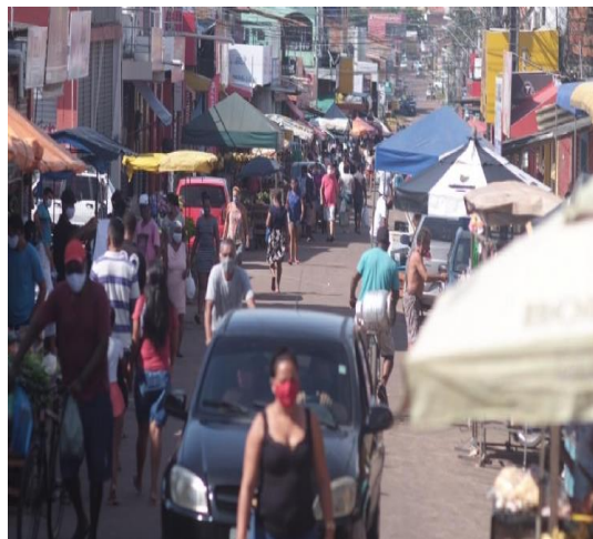
Figura 4 – Movimentação na feira.