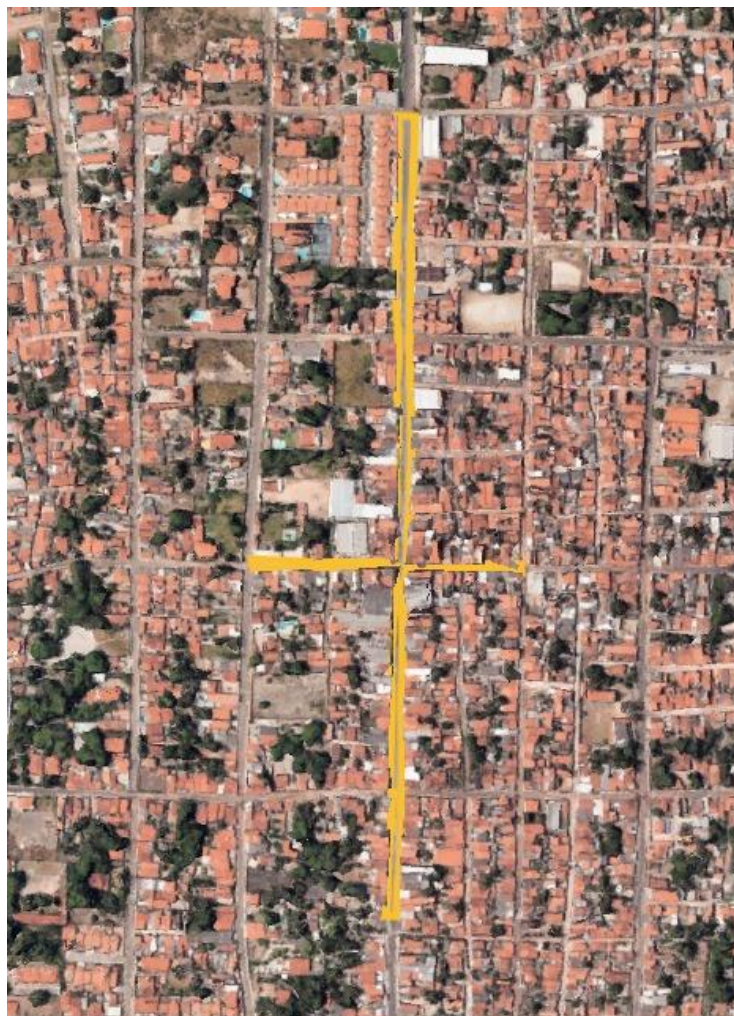
Figura 1 – Feira do Mangueirão.