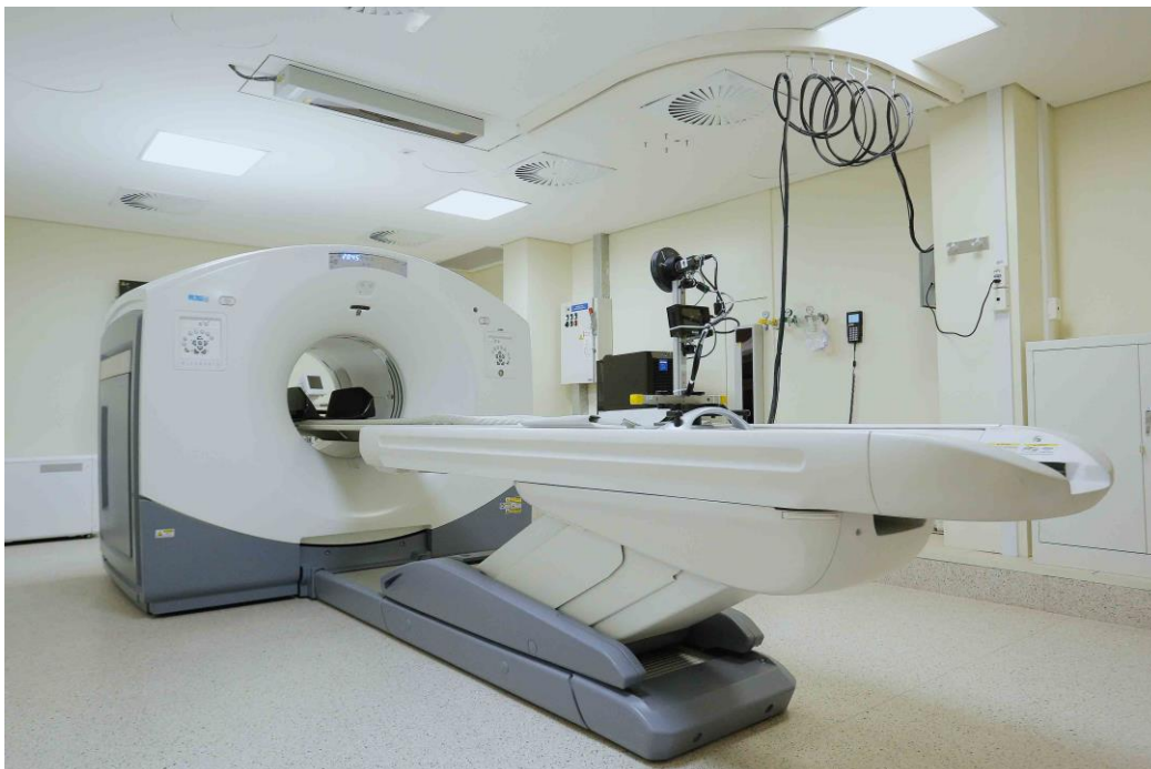
FIGURA 2. MÁQUINA DE PET/CT