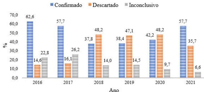
Figura 2. Percentual (%) de casos notificados de Zika Vírus segundo classificação. MatoGrosso, 2016 a 2021.