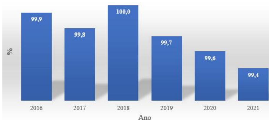
Figura 4. Percentual (%) de cura dos casos notificados de Zika Vírus. Mato Grosso, 2016 a 2021.