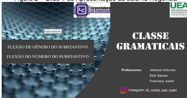
Figura 2 – Slide 1 de Apresentação da aula na Regência

A segunda aula foi de língua portuguesa e abordou o conteúdo de “acentuação gráfica e casos especiais de acentuação gráfica”, também trabalhamos a disciplina através de slides projetados e exercícios de fixação para os alunos.