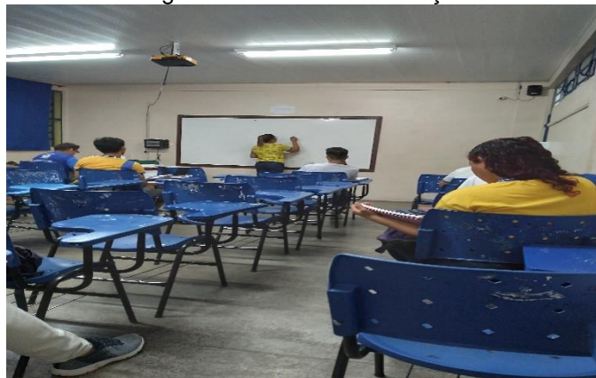
Figura 1 – Fase de observação