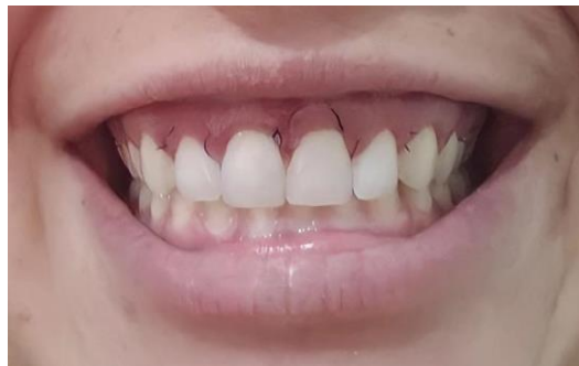
Figura 8 - Cicatrização do tecido gengival após 10 dias de cirurgia periodontal e remoção da sutura suspensória

Após uma semana de cirurgia, foi possível observar uma redução da exposição gengival no sorriso, que inicialmente era em média de 4mm e foi para 2mm, tendo como referência a região do incisivo central superior. As suturas foram removidas após 10 dias de cirurgia, devido a boa cicatrização do tecido gengival na região operada (Figura 8).