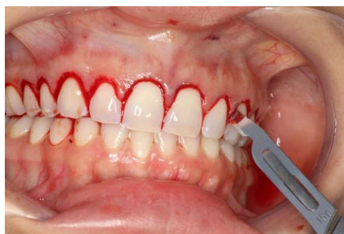
Figura 4 - Incisão intra-sulcular para ruptura dos ligamentos periodontais e possibilitando o descolamento do tecido gengival do tecido ósseo da paciente

Em seguida, efetuou-se a incisão intra-sulcular novamente (Figura 4) e a gengiva inserida foi descolada totalmente do perióstio com descolador de Molt 2/4G, gerando um retalho total do tipo envelope (Figura 5). O descolamento teve início na região de papilas e seguiu a inserção do tecido ao perióstio adjacente. A distância crista óssea alveolar à junção cimento-esmalte foi aferida com a sonda milimetrada Carolina do Norte (PCN), resultando em uma média de 2mm. A osteotomia de 1mm na crista óssea ao redor da face vestibular dos elementos dentários foi realizada com microcinzéis de Ochsenbein e ponta diamantada 2173 KG Sorensen em alta rotação (Figura 6), com constante irrigação com soro fisiológico.