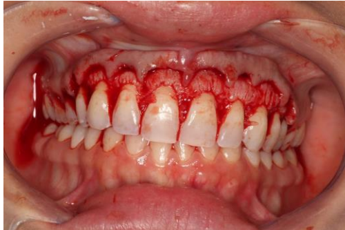
Figura 5 - Retalho do tipo envelope rebatido possibilitando visualizar o tecido ósseo da paciente