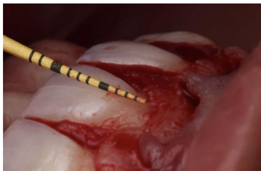
Figura 7 - Sondagem do espaço supracrestal com sonda do tipo Carolina do Norte, para verificar se a distância apresentava-se em 3 mm

Após o desgaste, checkou-se a distância supracrestal (Figura 7) e seguiu-se a etapa de fechamento. O retalho foi reposicionado e suturado com fio nylon 6-0 , com a sutura do tipo suspensória. Essa técnica confere conforto ao paciente e propicia o reposicionamento ideal das papilas, pois a sutura é suspensa na região lingual dos dentes e não é inserida em papilas palatinas.