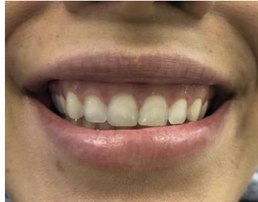
Figura 1 - Sorriso inicial da paciente onde é possível observar exposição gengival em excesso, além de uma anatomia dentária quadrada e contorno gengival reto