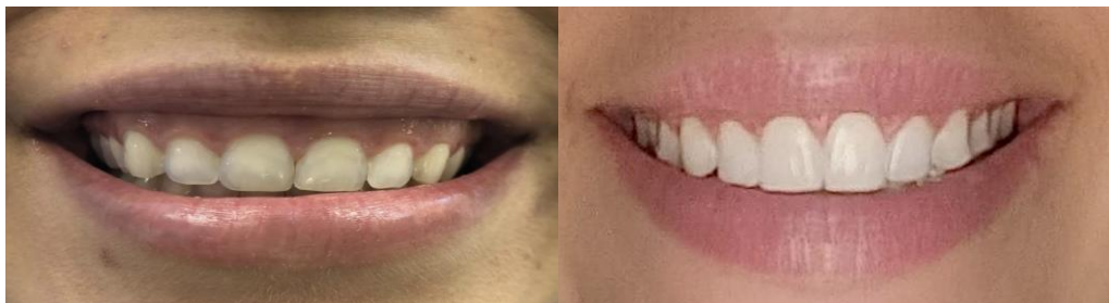
Figura 9 - Comparação entre o sorriso inicial e final da paciente. Observa-se a discrepância de exposição gengival ao sorrir e a dimensão das coroas dentárias iniciais e finais.