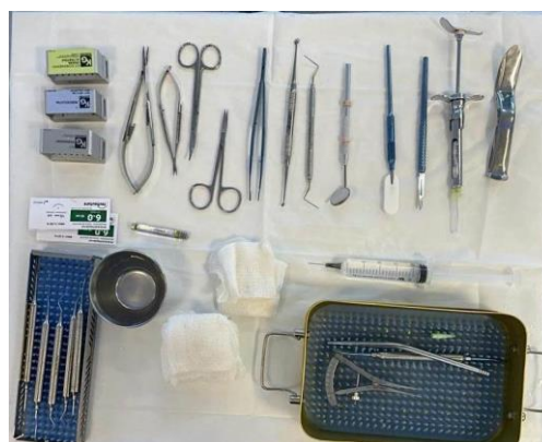
Figura 3 - Mesa cirúrgica montada com todos os instrumentais utilizados na cirurgia de gengivoplastia associada a osteotomia

Antes de realizar o procedimento, foram apresentados os riscos e benefícios da cirurgia por meio do Termo de Consentimento Livre e Esclarecido, e o processo teve início após o seu consento e assinatura. Inicialmente, foi montada a mesa cirúrgica (figura 3). Em seguida, procedeu-se com a antissepsia extra bucal da paciente com clorexidina a 2%, utilizando gazes e movimentos de raio de sol. A antissepsia intraoral foi feita com bochecho de digluconato de clorexidina a 0,12%.