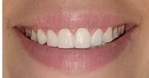
Figura 10 - Resultado da cirurgia periodontal após 60 dias, podendo observar redução da exposição gengival que havia em excesso