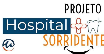
Figura 3: Identidade visual do Projeto Hospital Sorridente

No final do primeiro semestre do ano de 2022, foi solicitado pela Santa Casa de Misericórdia a elaboração de um projeto de extensão, para que professores e alunos, no âmbito do Sistema Único de Saúde, se incorporassem às equipes de terapia intensiva, realizando procedimentos de educação em saúde bucal, limpeza da cavidade oral, avaliação e diagnóstico odontológico, além do acompanhamento dos pacientes internados. Este projeto foi batizado de Hospital Sorridente (figura 3), o qual impulsionou a criação de um grupo de estudos em Odontologia Hospitalar (figura 4), no Centro Universitário de Patos de Minas. Os estudantes além de vivenciarem a prática da rotina hospitalar sob supervisão direta dos professores orientadores, tem conteúdos teóricos e treinamentos práticos realizados sob a égide das metodologias ativas de ensino-aprendizagem.