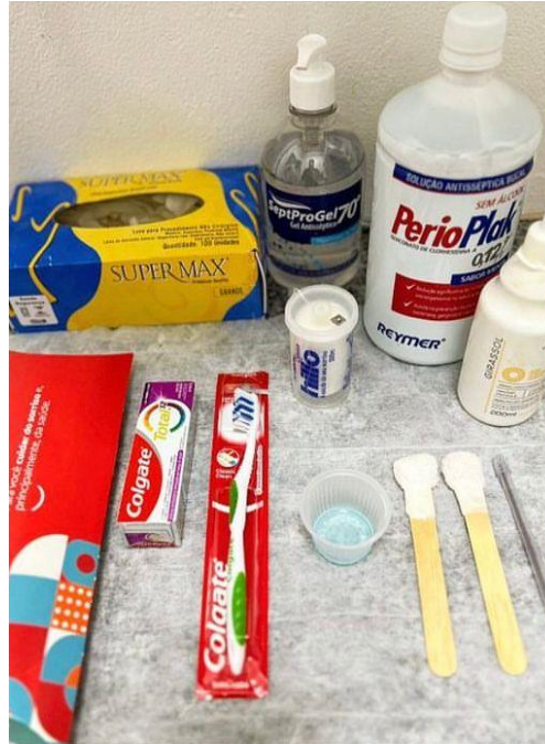
Figura 6: Mesa Clínica para os atendimentos na UTI