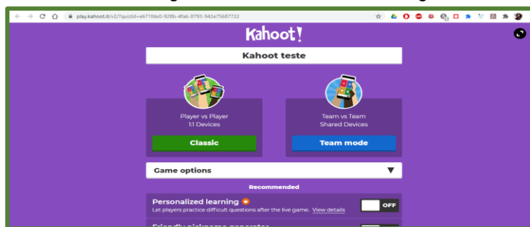
Figura 2: Plataforma Kahoot Regência

Diante disso, usamos um recurso tecnológico, o aplicativo Kahoot que é uma plataforma de aprendizado baseada em jogos, usada como tecnologia educacional em escolas e instituições de ensino. Seus jogos de aprendizado, “Kahoots”, são testes de múltipla escolha que permitem a geração de usuários e podem ser acessados por meio de um navegador da Web ou do aplicativo Kahoot.