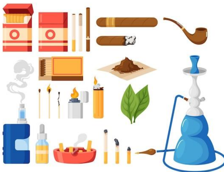
Figura 1. Produtos derivados do tabaco

Em conformidade com as orientações normativas do Ministério da Saúde e do Instituto de Nacional de Câncer José Alencar Gomes da Silva, o tabagismo é considerado uma doença procedente da dependência a substância nicotina, “droga presente em qualquer derivado do tabaco, como cigarro, charuto, cachimbo, cigarro de palha, cigarrilha, rapé, tabaco mascado (fumo de rolo), cigarro de Bali, narguilé (cachimbo de água usado para fumar), entre outros” (INCA, 2018).