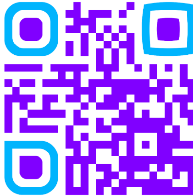
Figura 1 QR Code contendo o endereço de acesso ao questionário disponibilizado online disponibilizado aos discentes participantes da pesquisa.

O instrumento de pesquisa se tratou de um questionário constituído por questões semiabertas e objetivas ou fechadas, disponibilizadas aos participantes mediante um QR Code (Figura 1), que foi impresso e adesivado no quadro de avisos das turmas participantes.