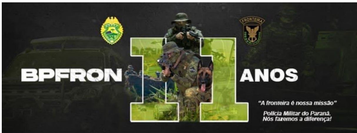
FIGURA 2: Slogan/Bpfron