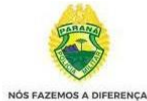
FIGURA 1: Slogan/Lema PMPR

conste o lema específico do BPFロン (A fronteira é a nossa missão), igualmente é mencionado o mote/lema atual da PMPR, qual seja, “Nós fazemos a diferença”.