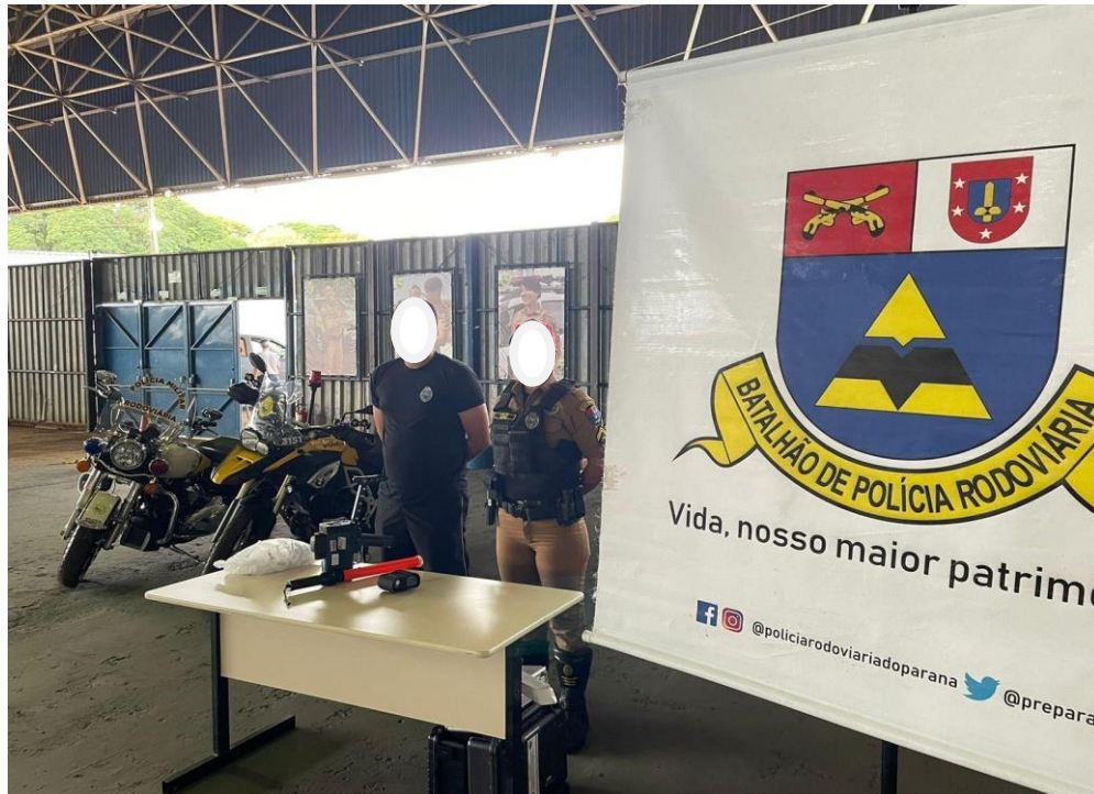
FIGURA 3: Slogan/Lema Batalhão de Polícia Rodoviária