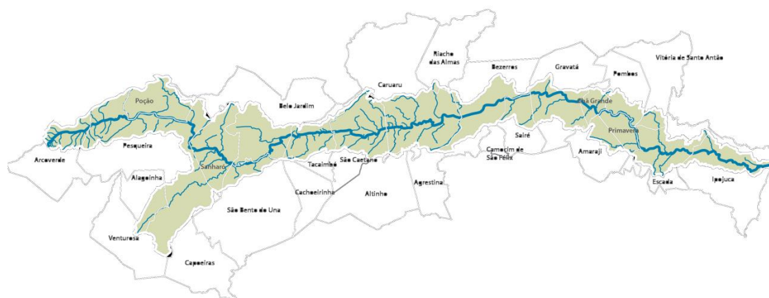
Figura 1. Vista de perfil da bacia hidrográfica do rio Ipojuca e seus municípios de entorno.

Á bacia do Rio Ipojuca (BHRI) localiza-se, em sua totalidade, no Estado de Pernambuco, entre 08°09'50" e 08°40'20" de latitude Sul, e 34°57'52" e 37°02'48" de longitude Oeste. Devido à sua conformação alongada no sentido oeste-leste, essa bacia tem posição estratégica no espaço estadual, servindo de grande calha hídrica de ligação entre a Região Metropolitana do Recife e a região do Sertão do Estado. Os trechos superior, médio e submédio da bacia estão localizados nas regiões do Sertão (pequena porção) e Agreste do Estado, enquanto que o trecho inferior tem a maior parte de sua área situada na zona da Mata Pernambucana, incluindo a faixa litorânea do Estado que limita-se ao norte, com a bacia do rio Capibaribe, grupo de bacias de pequenos rios litorâneos e com o Estado da Paraíba; ao sul, com a bacia do Rio Sirinhaém; a leste, com o Oceano Atlântico; e, a oeste, com as bacias dos Rios Ipanema e Moxotó e o Estado da Paraíba (Figura 1).