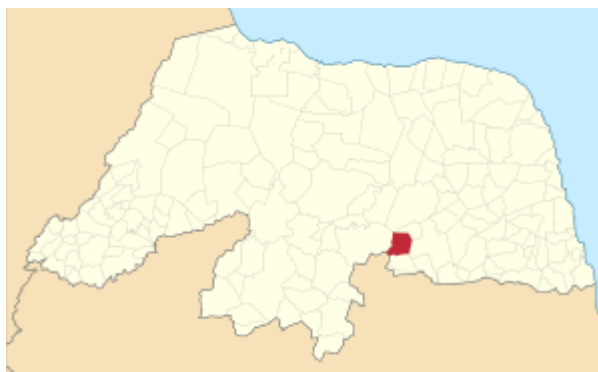
Figura 1: Localização da cidade de Campo Redondo - RN