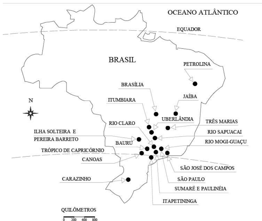
FIGURA 1 – Regiões brasileiras – solos colapsíveis