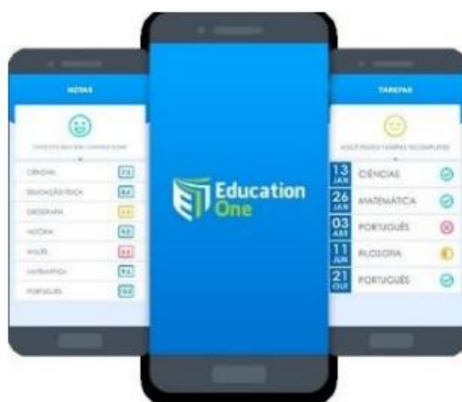
Figura 2 - Interface inicial do ambiente, com as interfaces de notas e tarefas

É importante citar, ainda, que existem aplicativos voltados a alunos e professores desenvolvidos para revolucionar a interação entre a escola, pais e alunos, como o aplicativo para escolas Education One (Figura 2), como o objetivo de estreitar ainda mais o vínculo entre instituição e a formação do educando. Os responsáveis têm acesso a tudo que envolve o aluno, participando mais ativamente do desempenho do estudante. A principal ideia da proposta é aumentar a produtividade e eficiência da instituição de ensino, voltado para gestão das escolas e instituições de ensino de todos os portes e todos os segmentos (Santucci, 2020).