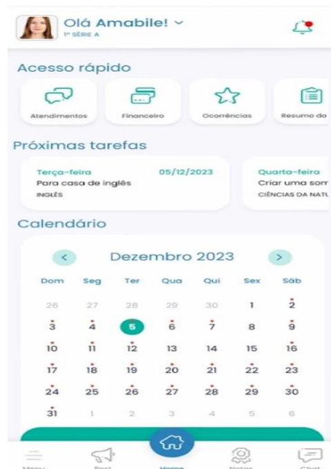
Figura 1 – Interface do aplicativo Escolaweb

Além das plataformas voltadas para gestão escolar, citadas no quadro acima, tem-se ainda o aplicativo Escolaweb (Figura 1), que foi desenvolvido para atender as necessidades de escolas que procuram uma solução do mercado, como facilitar a gestão escolar e através de suas opções como, agendar eventos, resumo do dia, cardápio escolar, aproximar a escola da família (Knieling; Kurtz, 2020).