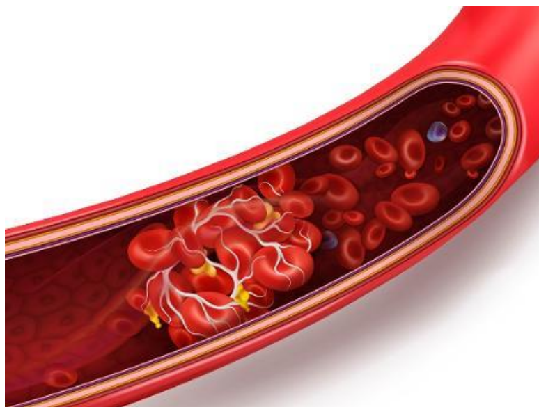
Figura 4: Hipercoagulação