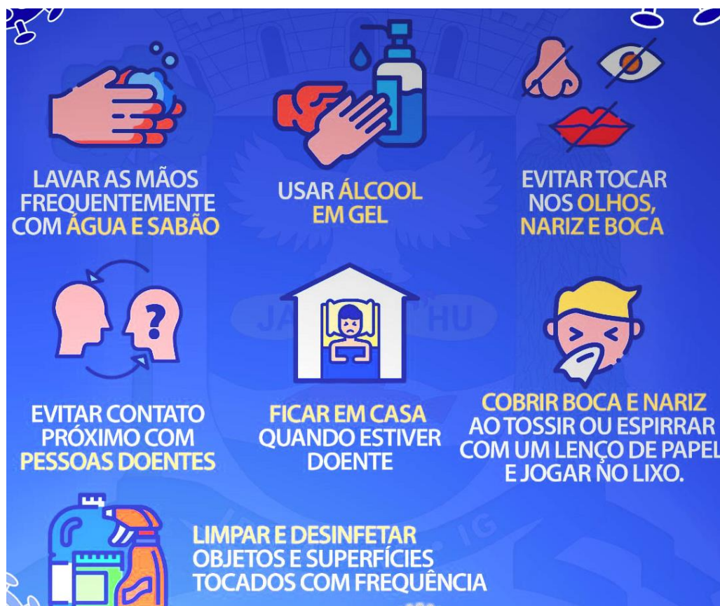
Figura 5: Atitudes preventivas contra a Covid-19