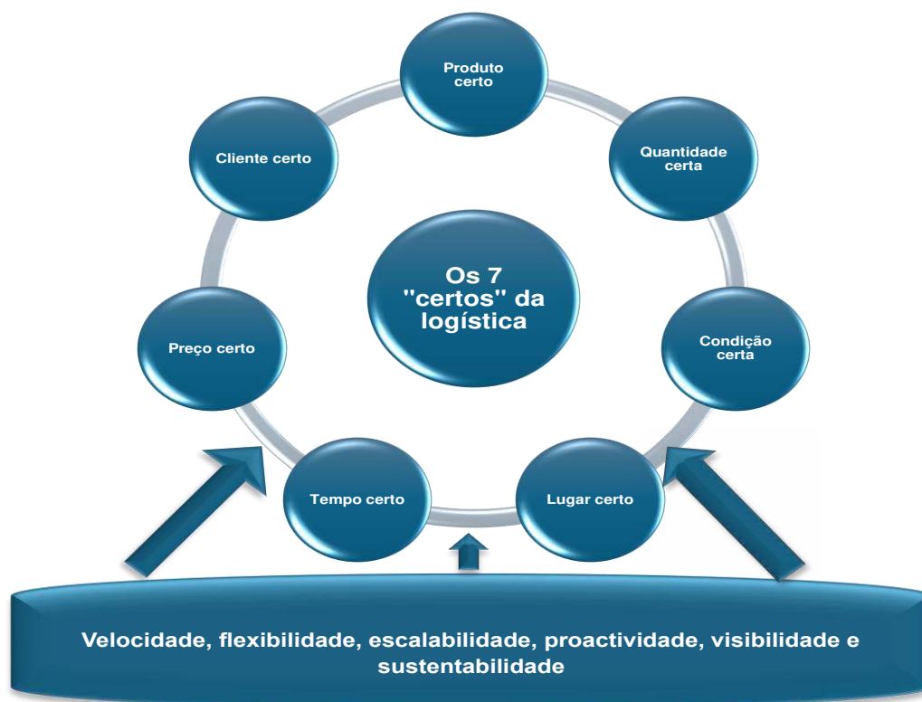
Figura 2: Os 7 “certos” e as habilidades de suporte

Portanto, o produto deve ser entregue ao cliente certo. Não se deve confundir cliente certo com o lugar certo porque cada cliente tem as suas necessidades. Muitas vezes os fornecedores acertam no lugar, mas erram no cliente por não saberem o que realmente o cliente terá pedido. O cliente é fundamental em todas as cadeias de abastecimento e deve ser apoiado tanto quanto possível. Por isso, deve ser atendido com aquilo que pediu.