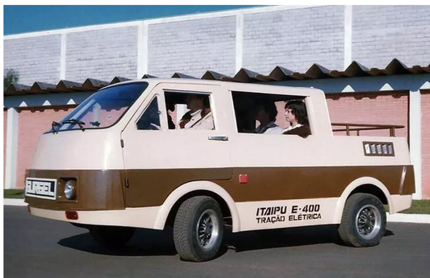
Figura 5: ITAIPIU E-400 é o primeiro veículo elétrico produzido no Brasil.

Tratando-se, agora, dos veículos elétricos, o Brasil foi pioneiro nesse assunto, pois o seu criador inicial, João Amaral Gurgel, apresentou em rede nacional em 1974 o primeiro modelo do veículo. O teste prático deu início em 1980, em que o modelo ITAIPIU E-400 teve o seu primeiro teste piloto (QUATRO RODAS, 2020). A figura 5 mostra o modelo Itaipu E-400.