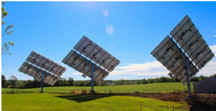
Figura 4: Modelo de instalação com sistema de rastreamento solar