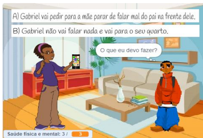
Figura 3 - Primeira cena interativa de escolha do game “AlieNÃO”. Recife, 2021.

Na cena 1, o primeiro cenário interativo, apresenta Gabriel e a sua mãe fazendo um comentário agressivo sobre o pai de Gabriel. Ao final, são mostradas duas opções: 1. Gabriel vai pedir para a mãe parar de falar mal do pai na frente dele, ou 2. Gabriel não vai falar nada e vai para o seu quarto. Dessa forma, o jogador deve clicar na opção que julgar ser a mais correta diante do contexto. Também observa-se, na parte inferior da cena, a barra de pontuações, a qual pode diminuir ou aumentar de acordo com a escolha do jogador (Figura 3).