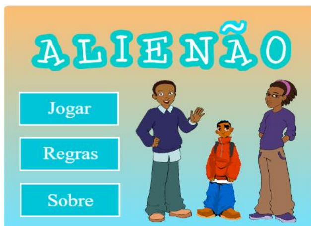
Figura 2 - Tela de início do jogo “AlieNÃO”. Recife, 2021.

Na Figura 2 observa-se a tela de início, a qual tem seu design composto por tons vibrantes de azul e laranja, de forma a ser atrativo para o público. Na parte superior, o nome do game é apresentado, os personagens principais da narrativa, Gabriel no centro e seus pais ao seu lado, e na lateral esquerda é apresentado o menu com as opções: jogar, regras e sobre.