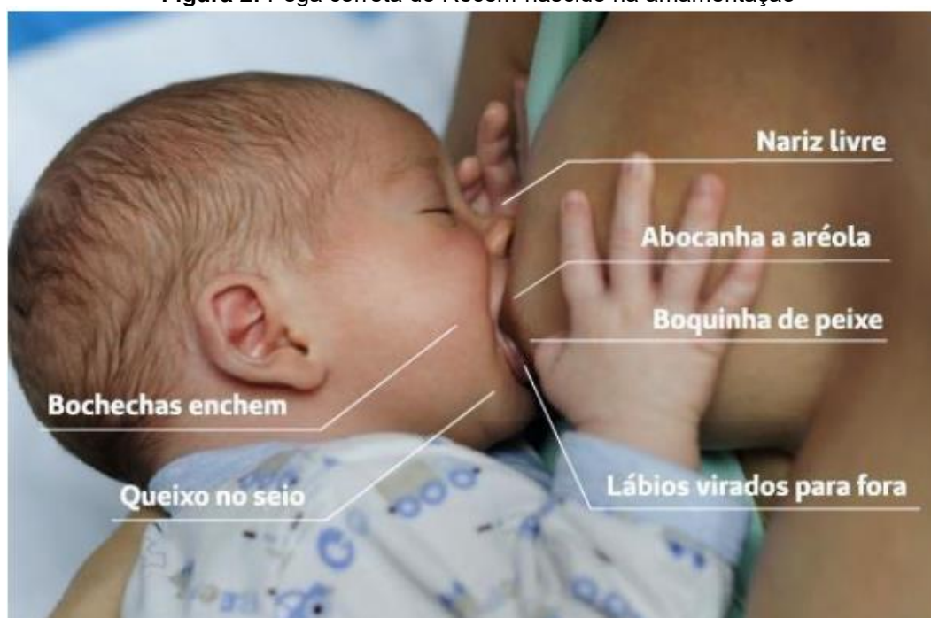
Figura 2: Pega correta do Recém-nascido na amamentação