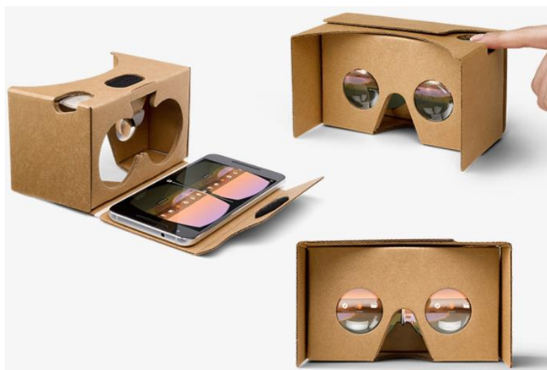
Figura 2 – Cardboard – Óculos de RV em papelão.