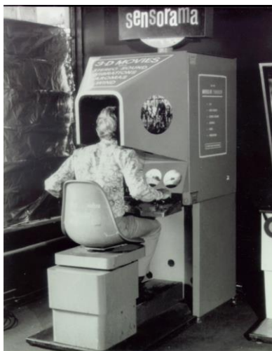
Figura 1 – Sensorama.

Segundo Braga (2001), A RV (Realidade Virtual) surgiu com a criação de simuladores de voo logo após a segunda guerra mundial. Em 1962, Morton Heilig patenteou o Sensorama, que foi o pontapé para o surgimento de novas ideias utilizando a tecnologia, como apresenta a Figura 1: