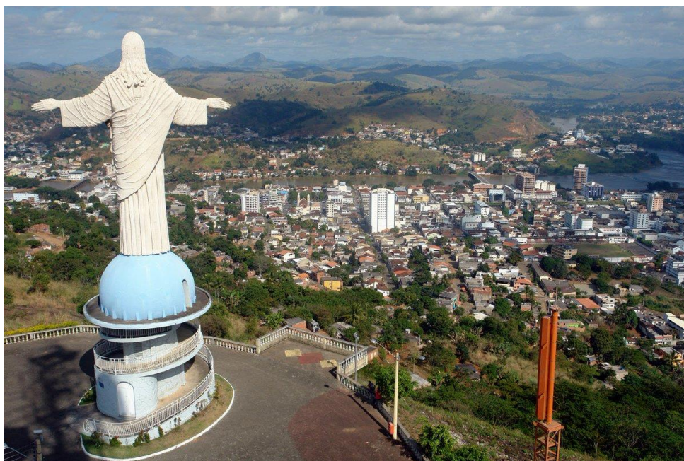
Figura 1 - Cristo Redentor de Itaperuna