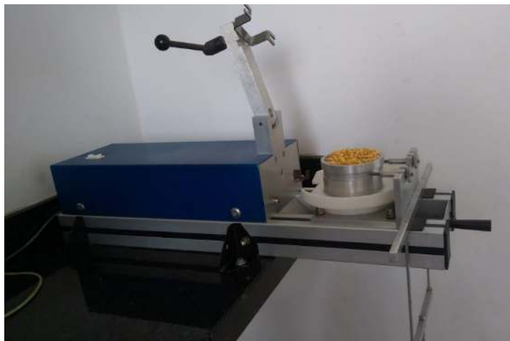
Figura 3. Jenike utilizado para determinação das propriedades de fluxo.

Foram determinadas as propriedades de fluxo: peso específico consolidado ( \gamma ), ângulo de atrito interno ( \phi ), efetivo ângulo de atrito interno ( \delta ) e ângulo de atrito do produto com a parede ( \phi_w ). Adotando a metodologia recomendada pela OPERATING INTRODUCTION FOR THE TRANSLATIONAL SHEAR TESTER (TSG – 70/140) utilizando o aparelho “Jenike Shear Cell” (Figura 3).