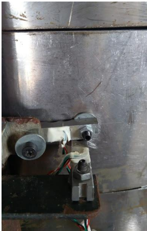
Figura 2. Células de carga