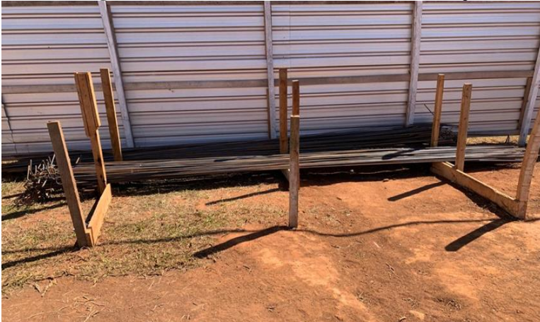
Imagem 3: - Armazenamento de barras de aço.