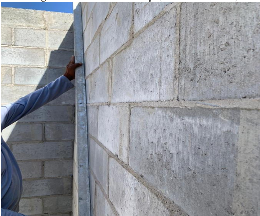
Imagem 9: Conferência de serviço (alvenaria estrutural)