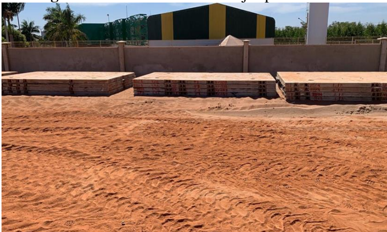
Imagem 2: Armazenamento de lajes pré-moldadas

No recebimento de materiais é utilizada a ficha de verificação e após a inspeção, os mesmos são movimentados e armazenados conforme as IT's (Instruções Técnicas), para que no momento do uso, poder ser encaminhado até ao local da execução de serviço, conforme Imagens 2, 3, 4, 5 e 6.