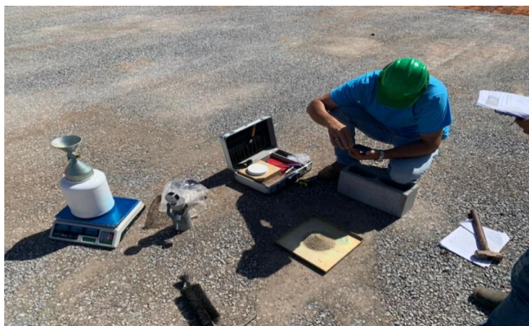
Imagem 7: Ensaio de compactação de solo

As Imagens 7, 8 e 9 ilustram parcialmente os serviços controlados.