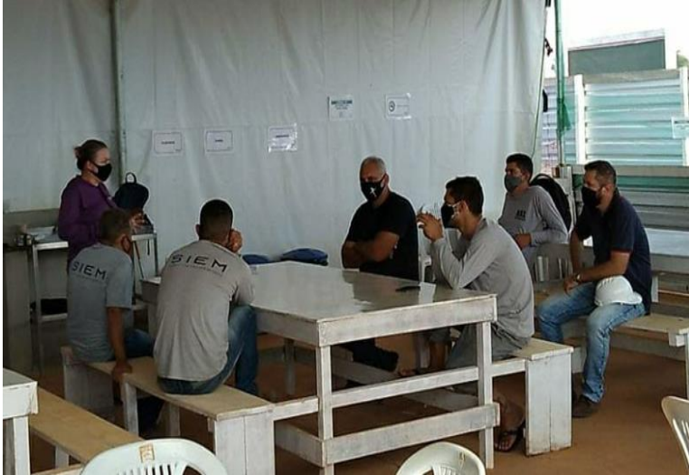
Imagem 1: Treinamento de funcionários