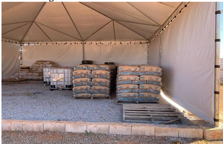
Imagem 6: Armazenamento de sacarias.