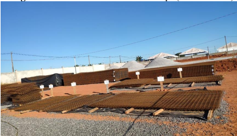
Imagem 4: Armazenamento de tela de aço (corte e dobra)