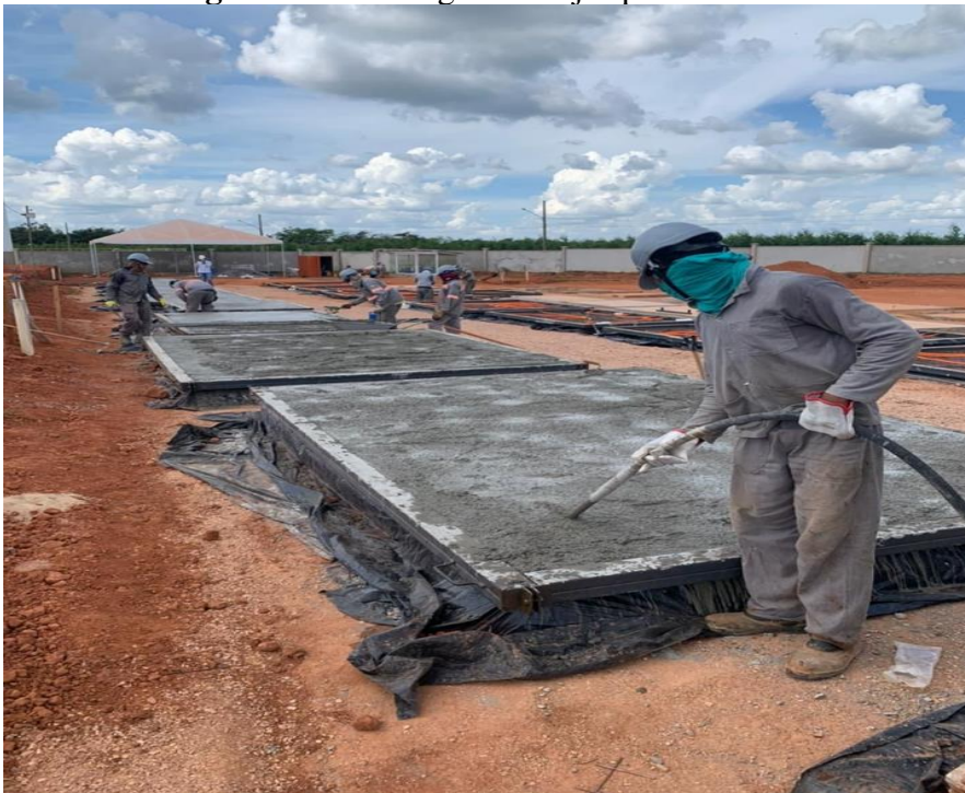
Imagem 8: Concretagem de lajes pré-moldadas