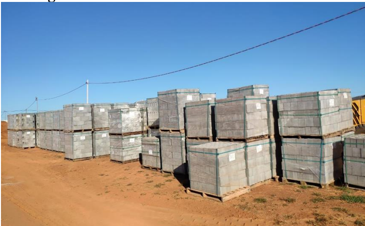
Imagem 5: Armazenamento de blocos em concreto