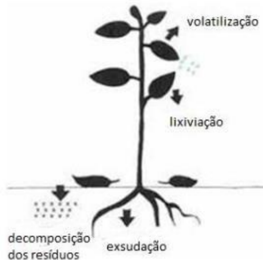
Figura 2: Vias de liberação dos agentes alelopáticos.

al., (2004) diz que a liberação destas substâncias ao meio pode ser através de lixiviação, volatilização, decomposição do vegetal ou por exsudação radicular (Figura 2).