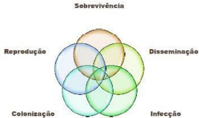
Figura 3: Ciclo do patógeno em plantas daninhas hospedeiras. Fonte: Material de estudos – Fitopatologia geral , 2014.

A Embrapa (2003), com o experimento sobre plantas daninhas como hospedeiras da praga Cochonilha-dos-tubérculos ( Protortonia navesi ), uma das principais pragas da mandioca no Cerrado brasileiro. Encontrou entre as principais plantas hospedeiras: A Buva ( Conyza canadenses ), Carrapicho rasteiro ( Acanthospermum australe ), Falsa serralha ( Emilia sonchifolia ), Picão preto ( Bidens pilosa ), Capim braquiária ( Brachiaria decumbens ) e Capim carrapicho ( Cenchrus echinatus ). Concluíram que o manejo das plantas daninhas e a rotação de culturas depois da colheita da mandioca, ou seja, na entressafra pode ser um importante meio para diminuir ou evitar a incidência desta praga na cultura durante o seu ciclo de produção.