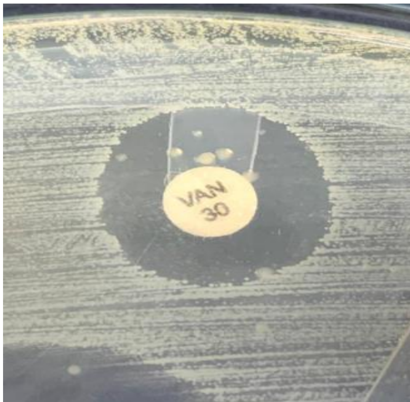
Figura 1 – Heteroresistência à Vancomicina.