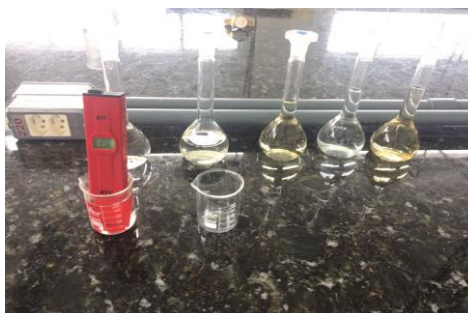
Figura 3. Determinação do pH das amostras de cachaça.

Determinou-se o pH utilizando um pHmetro eletrônico digital tipo caneta (Figura 3), com as cachaças a temperatura ambiente. Para realizar a análise, calibrou-se o equipamento (REF. pH-200), utilizando solução tampão pH 4,00 de fosfato de dissódio/fosfato de potássio monobásico; solução tampão pH 7,00 de biftalato de potássio/hidróxido de sódio. Em seguida foi adicionada a amostra de cachaça em um béquer e realizada a leitura direta após a estabilização das variações do equipamento.