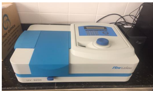
Figura 4. Equipamento Espectrofotômetro UV-Vis.

O método analítico utilizado para a determinação do cobre foi o espectrofotométrico, com o equipamento Espectrofotômetro UV-visível RAYLEIGH, modelo UV 9200 (Figura 4), disponível no Laboratório de Análise de Solo do IFNMG, Campus Almenara.