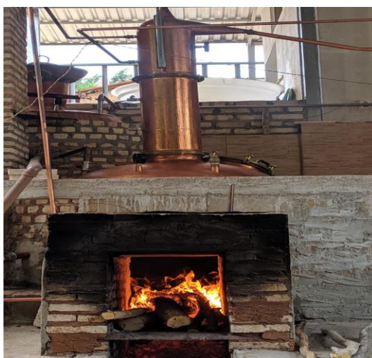
Figura 1. Alambique de cobre utilizado na produção de cachaça na Cidade de Coronel Murta-MG.

Ela possui características próprias de aroma e sabor conferidas pela presença de diversos constituintes do processo fermentativo. Além do etanol, muitos compostos orgânicos, como álcoois superiores, ácidos orgânicos e ésteres podem estar presentes. O processo produtivo da cachaça pode ser resumido pelos seguintes estágios: preparação da matéria prima como o corte da cana-de-açúcar, seguido da extração do caldo e sua fermentação. O resultado desta fermentação é levado à destilação em alambique tradicionalmente de cobre (Figura 1), onde este elemento tem a propriedade de reagir com os compostos sulfurados do vinho, impedindo que contaminem o destilado. Desta forma, as bebidas produzidas em alambiques deste material apresentam melhor qualidade sensorial (SILVEIRA, 2008; SANTOS et al. , 2011).