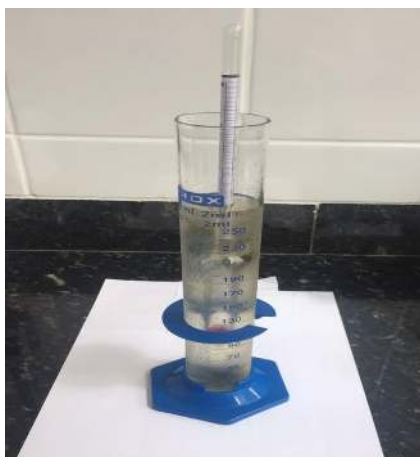
Figura 2. Determinação da graduação alcoólica da cachaça.

A graduação alcoólica foi realizada pelo método de densidade onde foi utilizado o densímetro alcoômetro (escala de 0 a 100 °GL) para medir o percentual de etanol presente nas cachaças (Figura 2).