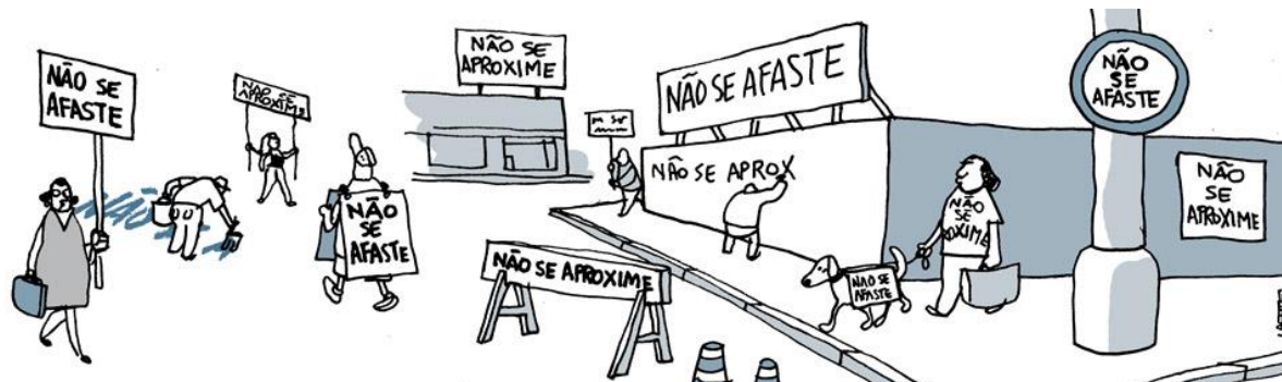
FIGURA 3 - Um “novo normal”: as realidades num mundo pós-pandemia.