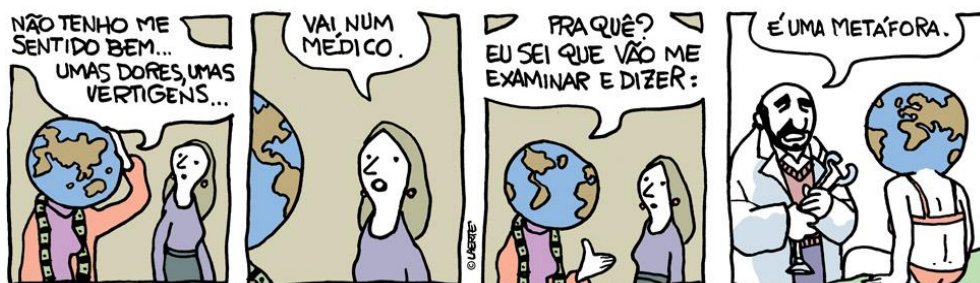
FIGURA 2 - Uma metáfora em tempos de COVID-19: suas terríveis consequências.