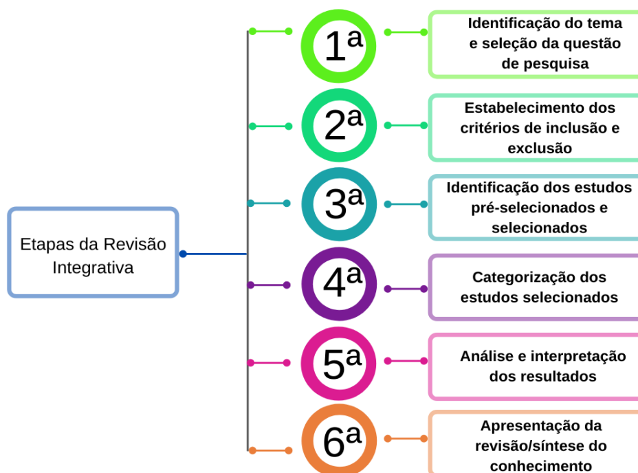
Figura 2 - Etapas da revisão integrativa