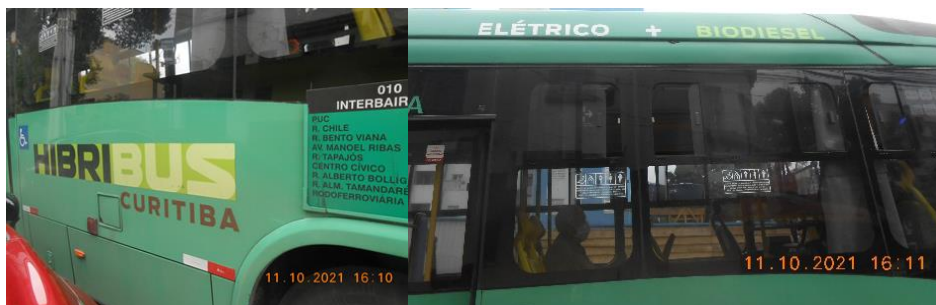
Figura 2. O híbribus em Curitiba-Brasil.