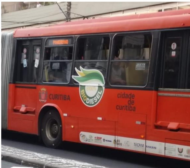
Figura 1. Bus Rapid Transport em Curitiba, Brasil. Combustível bi

apenas usar biocombustíveis sustentáveis. É urgente criar políticas para reduzir o transporte individual motorizado. O país precisa oferecer opções de direção ecológica, incentivos fiscais e motivar os consumidores a aderirem aos Sistemas de Transporte Inteligentes (ITS), sistemas de transporte público economicamente viáveis e customizados.