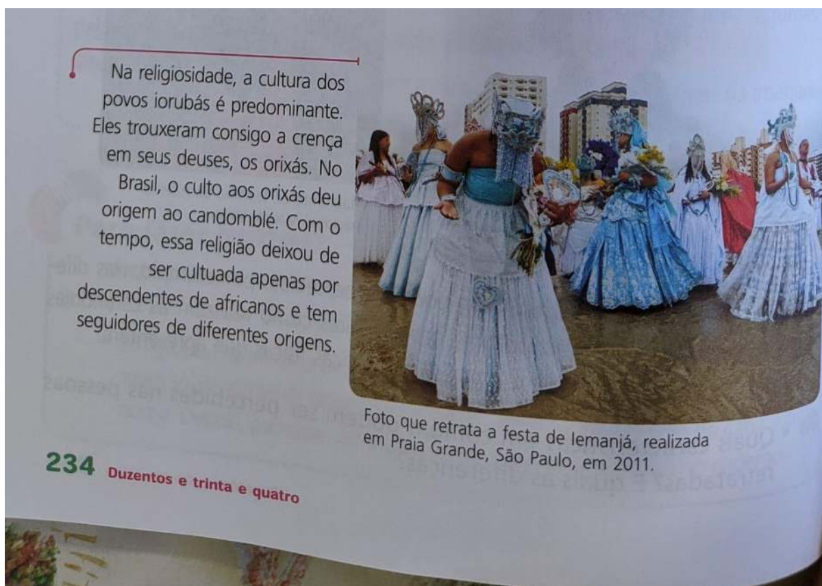
Figura 4. Representação de religião de matrizes africanas

A invisibilidade presente em outros materiais analisados traz uma questão que deve ser analisada pelas editoras e também para a educação. Como espaço que não existe neutralidade, é fundamental que a escola busque dialogar com a sociedade e traga um estudo sobre religiões com igualdade para o enriquecimento cultural e conhecimento sobre valores e princípios dessas