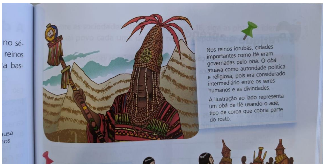
Figura 3. Representação de religião de matrizes africanas