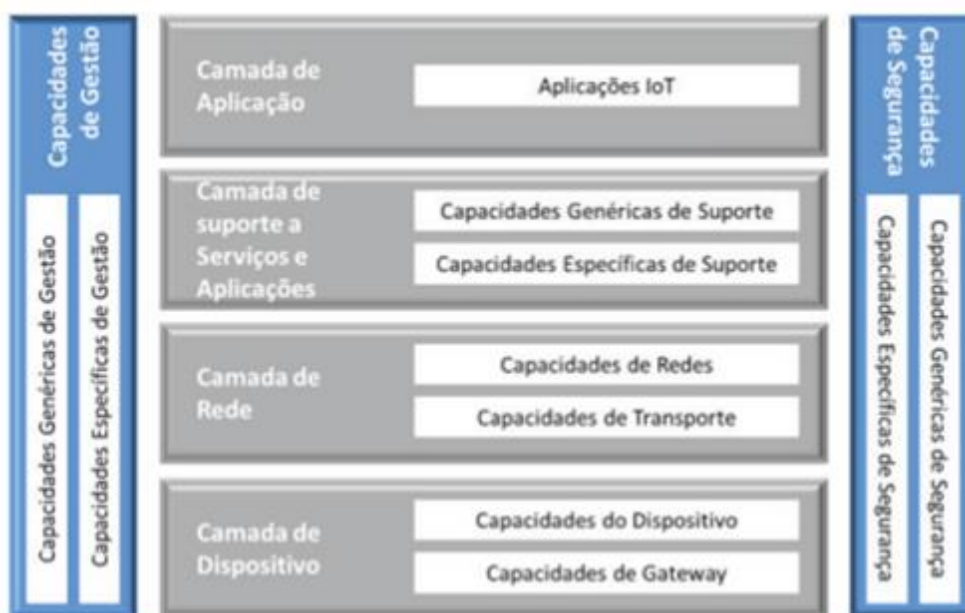
Figura 3 – As quatro camadas da arquitetura da IoT propostas pela ITU.