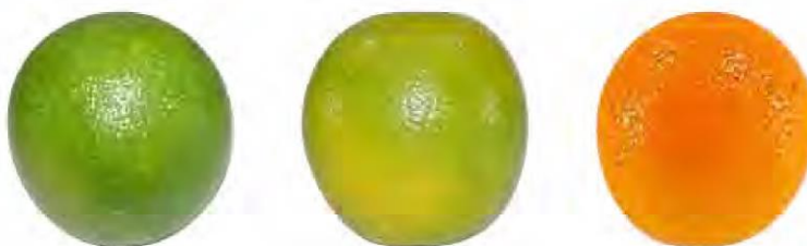
Figura 1 - Estádio de coloração da laranja

As Normas de Classificação de Citros de Mesa do Programa Brasileiro para Modernização da Horticultura da Companhia de Entrepósitos e Armazéns Gerais de São Paulo (CEAGESP, 2011) foram utilizadas para o acompanhamento visual do amadurecimento dos frutos durante o armazenamento através do estágio de coloração (Figura 1). Nesse estudo, a escala foi adaptada para 5 pontos: L1 - fruto verde; L2 - fruto mais verde do que laranja; L3 - quantidades iguais de verde e laranja; L4 - fruto mais laranja do que verde; e L5 - fruto totalmente laranja.