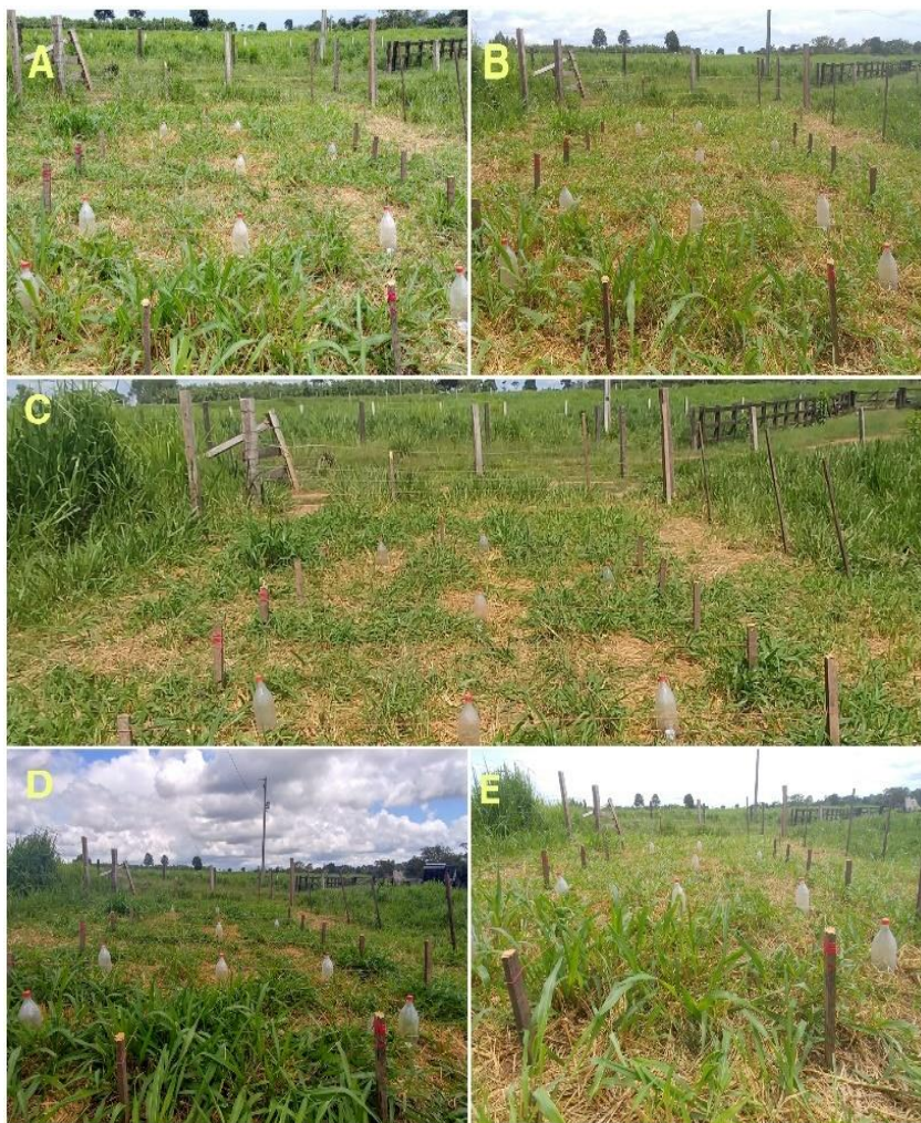
Figura 2 – Vista geral do experimento sendo as imagens referentes a primeira avaliação do primeiro dia de coleta após 48h (A), do segundo dia após 72h (B), do terceiro dia após 96h (C), do quarto dia após 120h (D) e do quinto dia após 144h (E) após a aplicação dos extratos pirolenhosos.