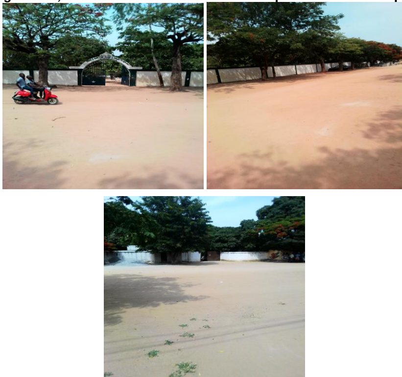
Figuras 14, 15 e 16. Fachadas dos cemitérios públicos do município.

Como plano de curto e médio prazo, para atender o direito costumeiro, prevê-se a construção de 2 cemitérios públicos sendo 1 a este e outro a sul do município, para além da capacitação do pessoal que trabalha no sector, aquisição de equipamento de trabalho e de proteção individual, a humanização do atendimento e flexibilização dos procedimentos administrativos.