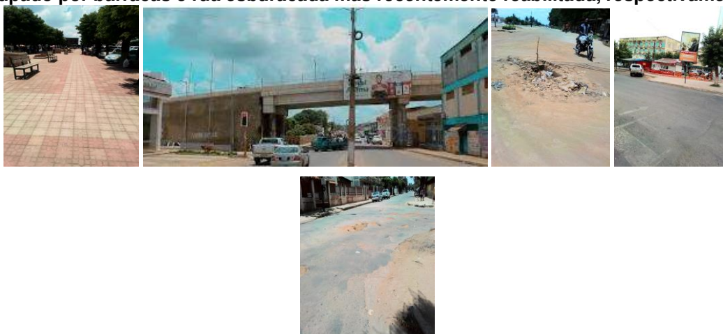
Figuras 4, 5, 6, 7, e 8. Passeio central reabilitado, viaduto, rua mal reabilitada, passeio central ocupado por barracas e rua esburacada mas recentemente reabilitada, respectivamente.

Como perspectivas a curto e médio prazo, aponta-se a continuação do tapamento de buracos, a aquisição gradual do equipamento e a extensão da manutenção para estradas rurais do município, estando em agenda também, a sensibilização dos sectores afins, para o abandono do processo de ocupação dos passeios por barracas, por forma a devolver urbanidade e beleza à cidade, em observância ao código de postura camarária.