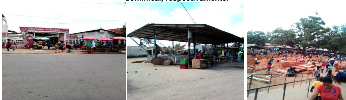
Figuras 20, 21, 22 e 23: Fachada do mercado central, mercado dos belenenses e feira dominical, respectivamente.

Como perspectivas a curto e médio prazo, para além de melhorar o volume das cobranças, prevê-se a transformação gradual dos mercados informais em formais.