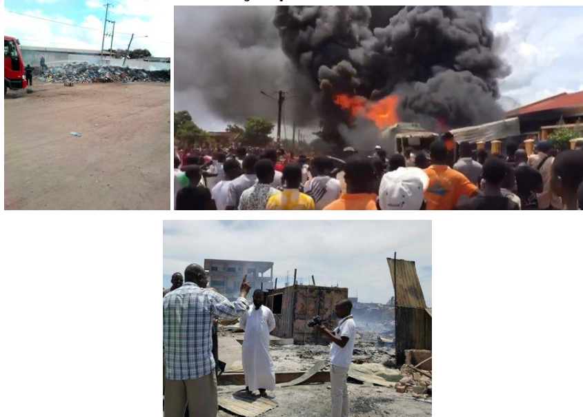
Figuras 24, 25 e 26: Corpo de salvção pública em combate de incêndio na cidade.

Por ora, não se vislumbram possibilidades de que este cenário venha a se alterar a curto e ou médio prazo.