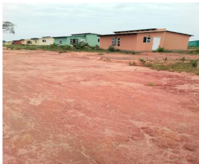
Figuras 9, 10, 11, 12 e 13: Diferentes vistas das habitações do Fundo de Fomento de Habitação.

Como perspectiva a curto e médio prazo, o FFH prevê a implementação de um programa de urbanização, que vai consistir no talhão infraestruturado, isto é, um talhão que possa ter um acesso automóvel melhorado, energia elétrica e água.