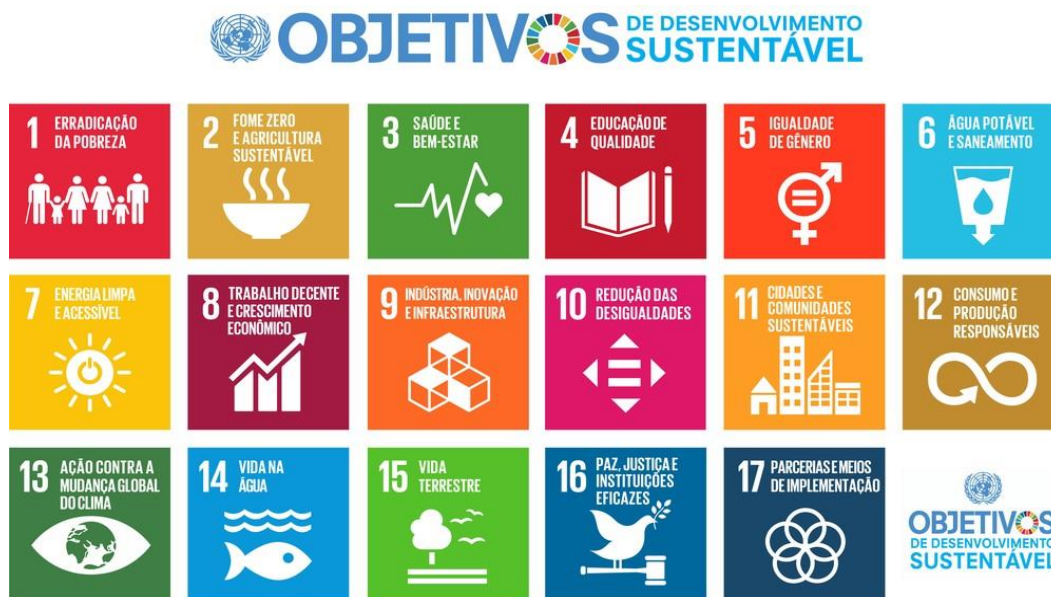
Figura 1 – Objetivos do Desenvolvimento Sustentável