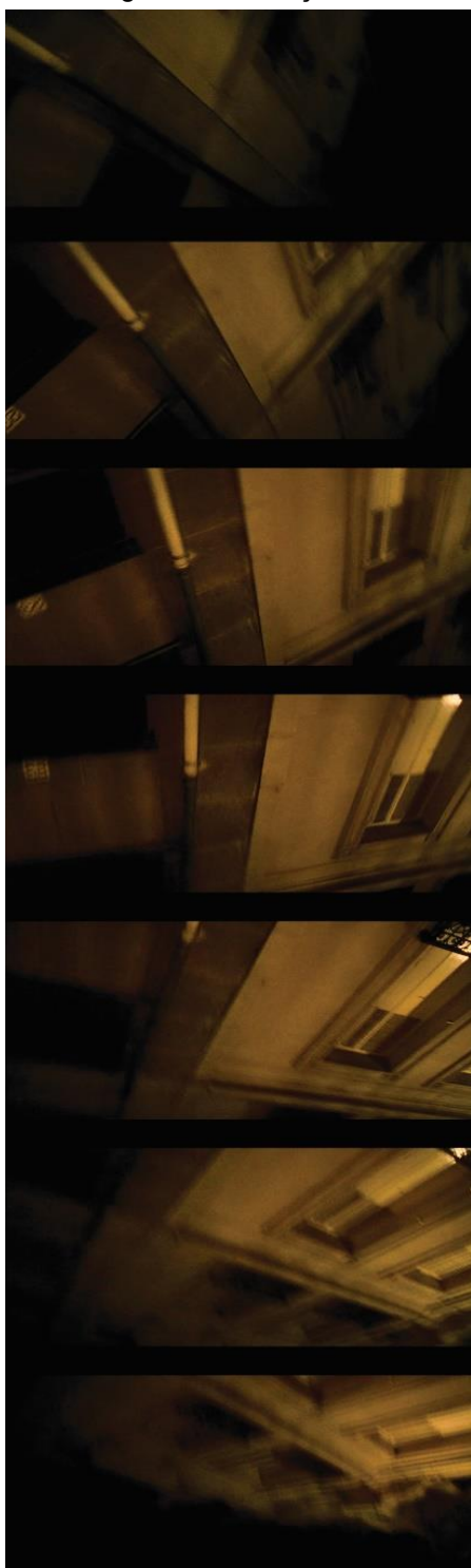
Figura 2 - Movimento de câmera circular: a saída do quarto, cena inicial, em um “mergulho” em direção à rua.

que o vemos com a incerteza de Marcus e Pierre no local hostil e claustrofóbico da boate” (HUNTER, 2003).