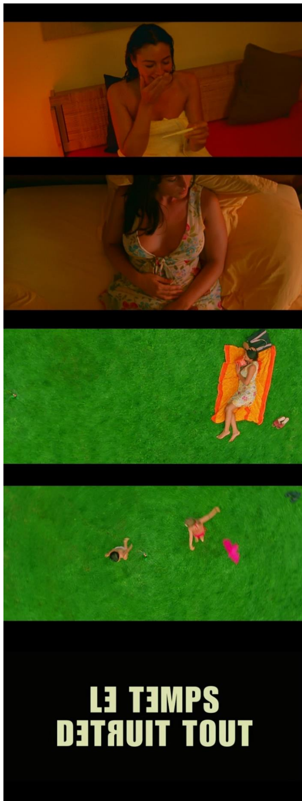
Figura 5 - A alegria de Alex ao descobrir que está grávida e a leitura pacífica no parque. Sentimentos impossíveis ao espectador, à lembrança dos letterings finais: “o tempo destrói tudo”.

A EXPERIÊNCIA CINEMATOGRÁFICA EXTREMA: IRREVERSÍVEL E OS ENVOLVIMENTOS COM O ESPECTADOR Gabriel Perrone Vianna