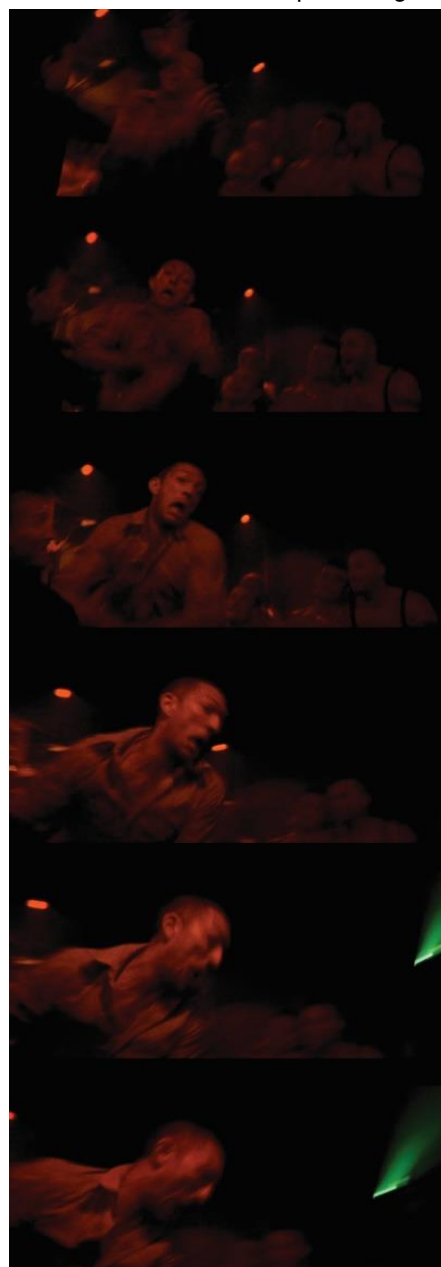
Figura 3 - A perda de controle na cinematografia em aproximação aos estados emocionais das personagens.