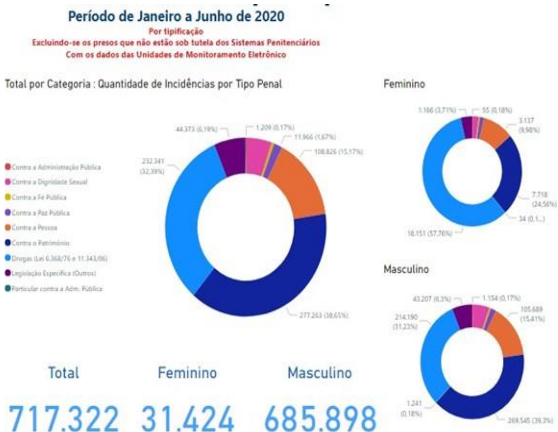
Gráfico 2 - Número de Presos no Brasil

Se observarmos o cenário atual, verificamos uma curva ainda mais ascendente, pois a população carcerária somente aumenta. Os dados mais atuais são de um total de mais de 717.000 (setecentos e dezessete mil) presos, nas mais diversas categorias de ilicitudes, sendo a maioria de crimes contra o patrimônio e tráfico de drogas em geral, sendo que ambos dividem quase a mesma proporção.