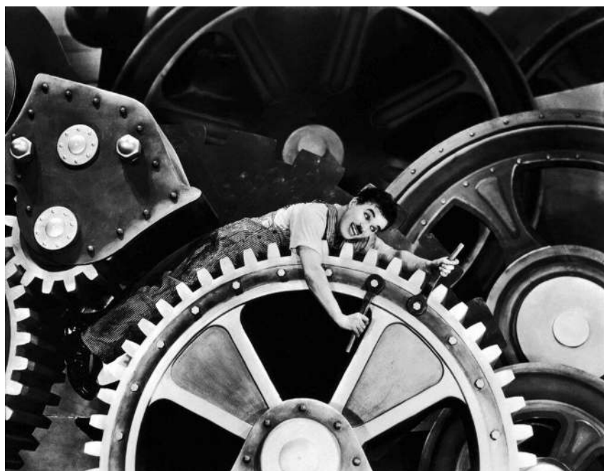
Figura 1 – Charles Chaplin é engolido pela máquina. “Tempos Modernos”, 1936.

E como falar em Revolução industrial e esquecer a emblemática foto extraída do filme Tempos Modernos, protagonizado por Charles Chaplin. O homem assustado é engolido pela máquina, que dita à velocidade da produção. O trabalhador alienado deixa de ser considerado humano e começa a fazer parte da máquina, conforme FIGURA 1, a seguir: