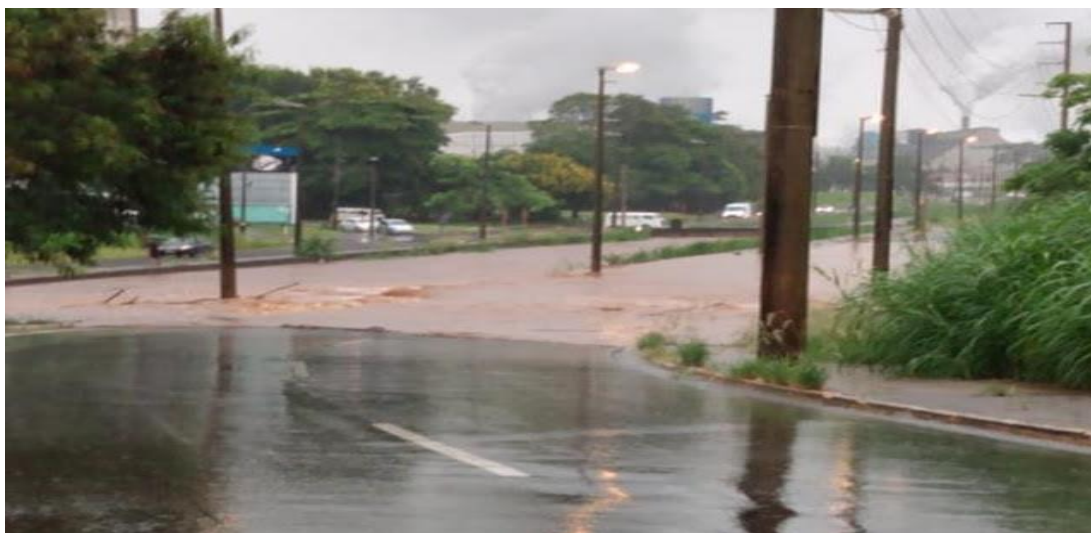
Figura 5: Trecho da Avenida Maria Antônia Carmargo de Oliveira coberta pela água do Córrego das Servidão, devido ao excesso de chuva.

De acordo com Angeli (2020), o córrego do trecho que compõe a Avenida Maria Antônia Camargo de Oliveira, com as chuvas de verão, apresenta transbordamento, cobrindo totalmente as vias e os viadutos (figura 5), durante as chuvas fortes, que também causam erosão e levam toda a terra das margens.