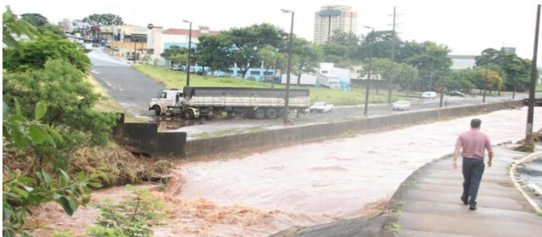
Figura 4: Trecho da Avenida Maria Antônia Carmargo de Oliveira, com o Córrego das Servidão em processo de alagamento.

De acordo com o Instituto de Pesquisas Tecnológicas (IPT, 1981 apud PERRE et al. , 2017), Araraquara/SP está inserida na província geomorfológica de nome Planalto Ocidental, com relevo caracterizado por vales relativamente rasos, com encostas de inclinação suave, o que o torna visivelmente ondulado, com colinas amplas e baixas, definindo tal forma.