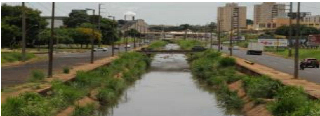
Figura 3: Córrego das Servidão (canalização)

No município de Araraquara/SP, mais especificamente na Avenida Maria Antônia Camargo de Oliveira, que foi instalada nas várzeas do Córrego da Servidão (figura 3), são frequentes enchentes (figura 4) em época de chuva em demasia, afetando o tráfego da população, inclusive entre cidades, pois a rodoviária municipal é próxima do local. Tal problema é resultado do aumento das áreas urbanizadas e da impermeabilização do solo.