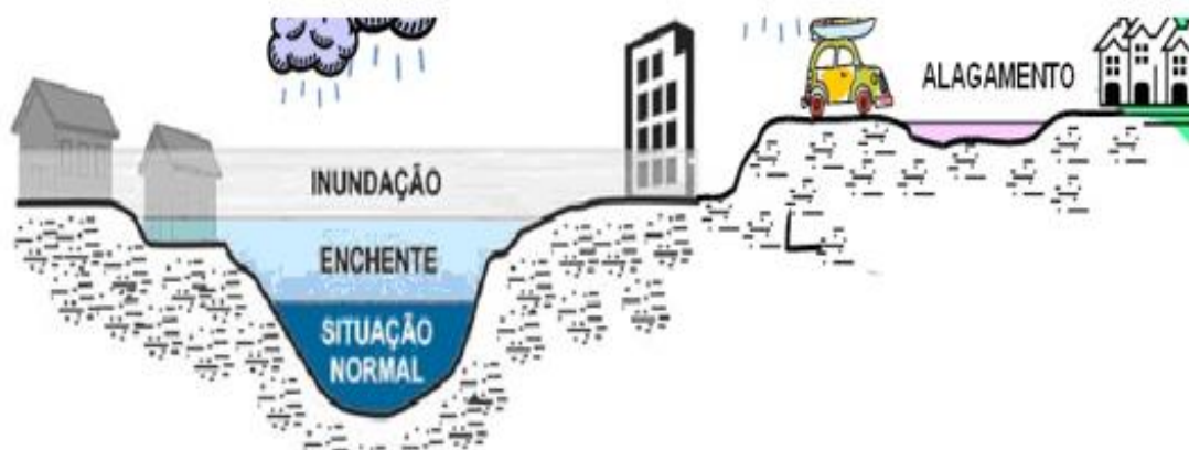
Figura 1: Representação de inundação e enchente

Para Carvalho e Silva (2006 apud PERRE et al. , 2017), a inundação vem a ser a elevação não usual do nível da água em seu curso, o que provoca seu transbordamento e possíveis prejuízos a população que vive no local que foi inundado, bem como aos responsáveis pela preservação e manutenção da área. Ela sobrepõe a enchente, como pode ser visto na figura 1.