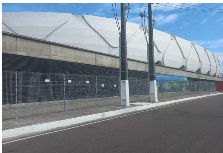
Figura 4: Postes na calçada.

Outro obstáculo encontrado em torno da Arena, foi a presença de postes no meio da calçada de iluminação e de sinalização (Figura 4), restando aproximadamente cerca de 95 cm para que uma pessoa ou deficiente físico portador de cadeira de rodas atravesse.