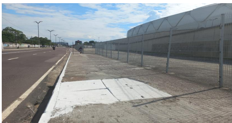
Figura 3: Tampa de esgoto e rachaduras na calçada.

No entanto, ao redor da Arena da Amazônia foram vistos diversos buracos (Figura 3) ou rachaduras nas calçadas, o que se configura como uma barreira para a locomoção deste público, assim como, a presença de tampas de esgotos, de aproximadamente 2,62 m de comprimento por 98 cm de largura.