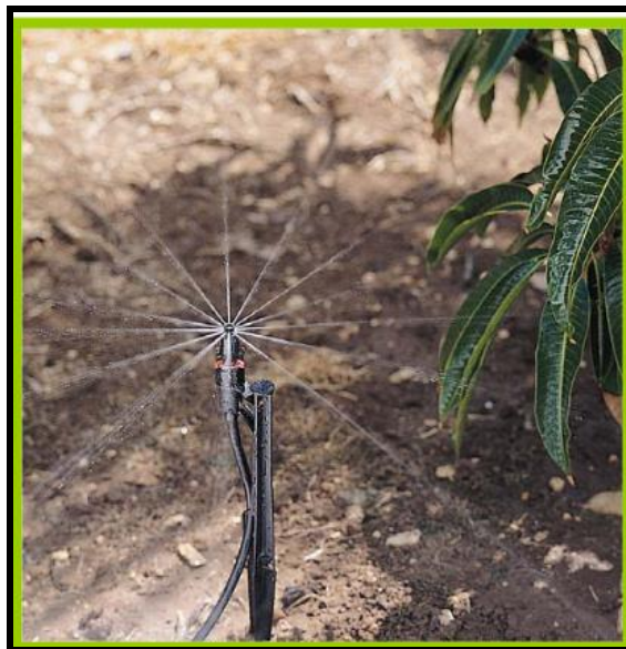
Figura 3: Microaspersor com spray

Conforme é demonstrado na figura acima, os Microaspersores ou “ sprays ” são pequenos aplicadores (também chamados aerossol, microsprayers ou aspersores em miniatura) usados na irrigação por “ spray ”. Cobrem áreas de aproximadamente 1 a 10 m (TESTEZLAF, 2011).