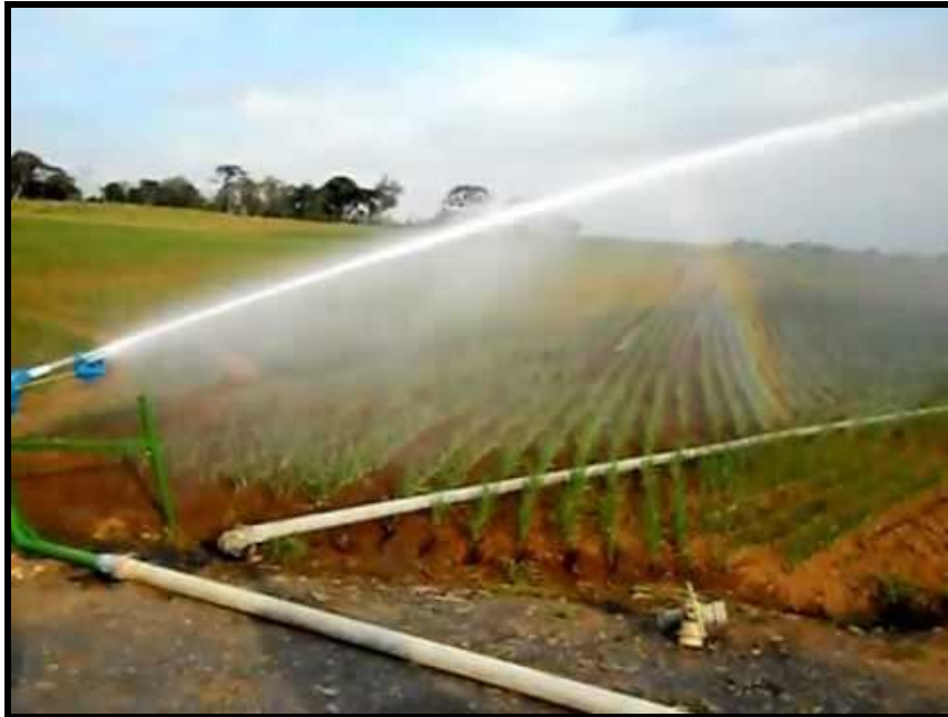
Figura 1: Irrigação por aspersão tipo canhão

INFLUÊNCIA DA IRRIGAÇÃO POR MICROASPERSÃO NA PRODUTIVIDADE DA GOIABEIRA Antonio José Santos