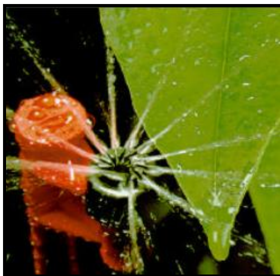
Figura 4: Microaspersor rotativo com bailarina

Na pesquisa real ziada por Leão e Soares (2000), se constata que este método de irrigação oferece vários benefícios, dentre eles o aumento na produtividade e também na qualidade das plantas.