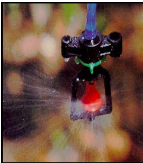
Figura 5: Microaspersor rotativo com bailarina

Para Falagán (2014) devido à escassez de água no mundo, a irrigação deve ser otimizado, mantendo a qualidade do fruto.