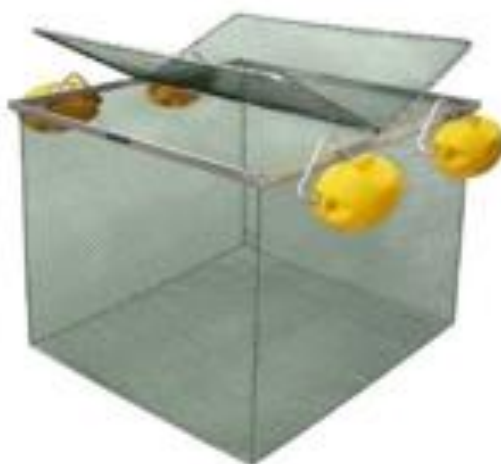
Figura 1: Tanques-rede.