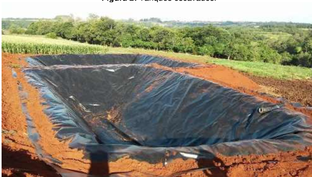
Figura 2: Tanques escavados.