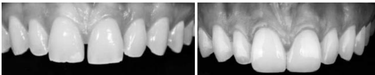
Figura 5: Paciente com presença de diastemas entre elementos 11 e 21. Em seguida, após a realização de facetas cerâmicas com alta precisão e excelência estética