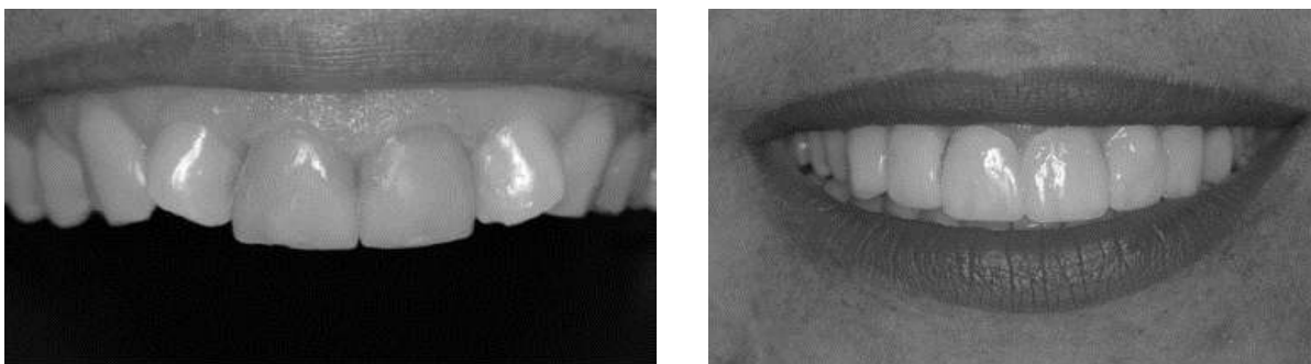
Figura 1 - Inicial e final da realização da faceta direta. Dentes anterossuperiores desproporcionais. Incisivos centrais escurecidos e incisivos laterais girovertidos. Após a realização da faceta direta, nota-se um ganho expressivo na harmonia do sorriso. Melhora na forma, cor e alinhamento dos dentes.