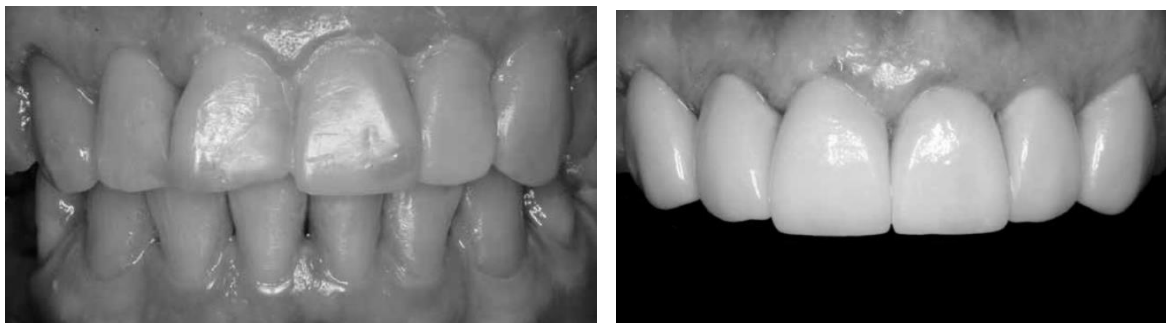
Figura 4 - Paciente com dentes manchados, quebrados e escurecidos. E em seguida, laminados cerâmicos logo após a cimentação, com a gengiva levemente traumatizada após os procedimentos de remoção dos excessos de cimento resinoso e polimento.