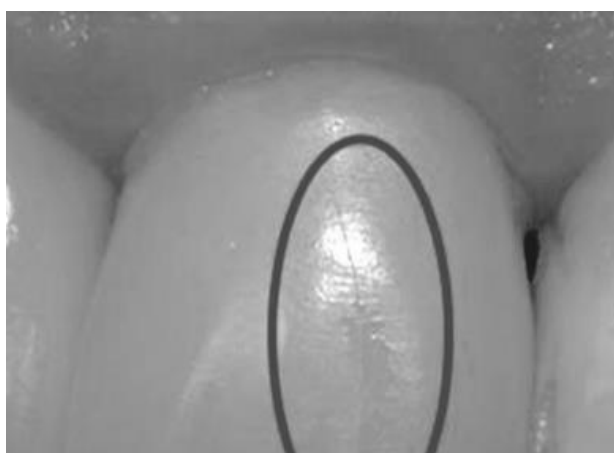
Figura 7: Presença de trinca na restauração de faceta

Existem diversos fatores que podem levar a falhas, a carência de uma boa elaboração do estudo do caso, a escolha não correta da cimentação, preparos sem embasamentos, o assentamento não unificado da aplicação de faceta no momento da etapa de cimentação, o excedente ou a supressão de cimento durante a etapa da cimentação e o uso de cimentos que apresentam polimerização de forma dual, são características de causas que ocasionam grandes falhas (SILVA NETO et al. , 2020).