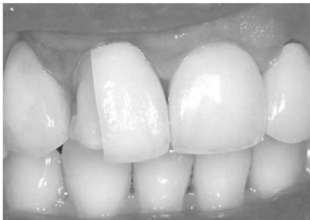
Figura 6: Fratura do laminado cerâmico.